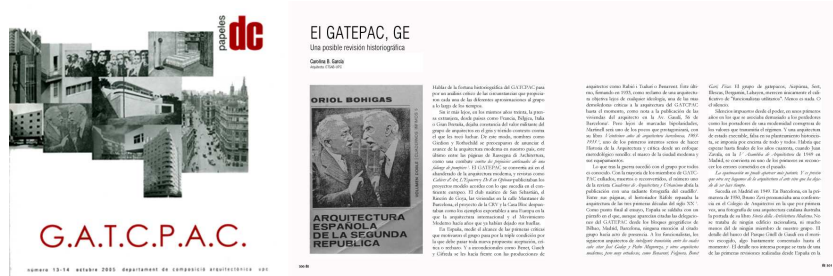
Fig. 2. Número monográfico de la revista DC dedicado al GATCPAC, 2005.

Es interesante pues observar cómo la revista en sí misma es también un instrumento activo, una herramienta crítica cuyo formato y resultado varía, depende y se adapta a las diferentes circunstancias del grupo humano que la crea y la moldea según unas necesidades que son propias pero también dependen del momento histórico y sus sinergias. Además de reflejar las producciones académicas del departamento, la propia revista es también un espejo de la evolución intelectual de los estudiantes que la crean y la dirigen, y de su continuo enfrentamiento con la práctica de la reflexión crítica, del pensamiento crítico sobre la arquitectura como una disciplina social y la ciudad.