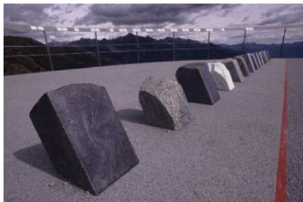
Fig. 5. Alineamiento de la geología existente. Paolo L. Bürgui, Suiza, 2000.

A base de crear nuevos senderos, recorridos y áreas de reposo a través de sus bosques, hace partícipe al usuario de la cualidad del lugar, más allá del simple "llegar y mirar". El circuito generado se completa con un corredor suspendido entre los árboles hasta un mirador que vuelca sobre la propia cordillera.