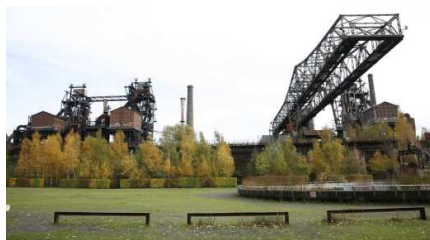
Fig.21. Antiguas construcciones fabriles incorporadas al parque. Latz & Partener, Alemania, 2000.

El parque Duisburg Nord se enmarca en la proposición de reconvertir una antigua región industrial en una zona de mejora social y económica del entorno, tratando de integrar, reinventando el espacio industrial existente, muy fragmentado, para intentar darle una nueva interpretación.