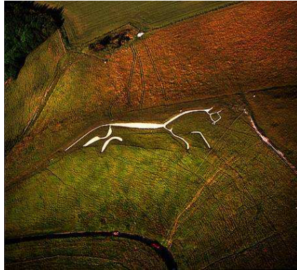
Fig.20. El caballo blanco de Uffington en Berkshire, Oxfordshire, Inglaterra, 100 d. de C.

Pero más allá de la simple introducción de un elemento artístico en un lugar, son actuaciones en las que el elemento de arte interactúa con el paisaje, llegando a un extremo de fusión entre ambos que, una vez percibidos en conjunto, difícilmente se pueden entender por separado.