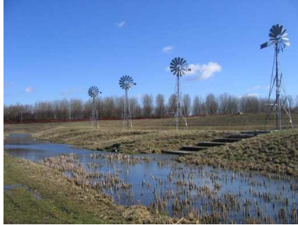
Fig. 16. Los molinos de viento como energía eólica. Paysages, Harnes, 2004.

El sistema de lagunas que ha creado Paysages, además de depurar el agua, reestructura todo el territorio, tanto desde un punto de vista social como geográfico. Una intervención que, junto con el considerable aumento de la biodiversidad local, ha conseguido recuperar la identidad perdida de los habitantes, apoyándose en los factores climáticos que le dieron origen.