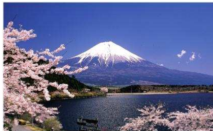
Fig. 6. El monte Fuji Yama, la montaña perfecta. Isla de Honshu, Japón.

La topografía identitaria acompaña a las distintas organizaciones sociales, a las diferentes religiones y a los desiguales puntos de la tierra. Este reflejo se produce de una forma directa con un relieve existente que sirve de referencia constante en el paisaje, aunque su significado supere los límites estrictamente físicos.