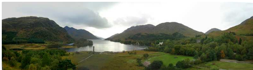
Fig. 14. Paisaje de Glenfinnan, Highlands, Escocia.

Los factores climáticos han condicionado la relación del ser humano con el paisaje desde el inicio de los tiempos. El clima ha propiciado en el hombre tanto miedo –asociado a su vertiente de inclemencia y desprotección□ como adoración 10 , influyendo en la ubicación de nuevos asentamientos y en la organización de los mismos, pasando a ser una de las piezas claves de la interconexión de los habitantes con sus paisajes.