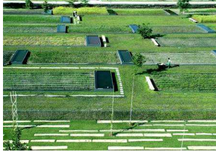
Fig.19. La zona de etnobotánica. Mosbach paysagistes, Burdeos, 2002.

Especialmente significativo es la zona de etnobotánica, con los campos de cultivo de las distintas especies, en los que se reproduce tanto el modo de plantación alineada, como el sistema de riego. La forma de irrigación, con una alberca en la cabecera de cada parcela, se distribuye por los surcos igual que en los cultivos de producción agrícola. Sin embargo la disposición no busca la explotación, sino la exposición pedagógica, creando recorridos y áreas de descanso entre los campos; consiguiendo una nueva identidad para el lugar basada en el factor agrícola.