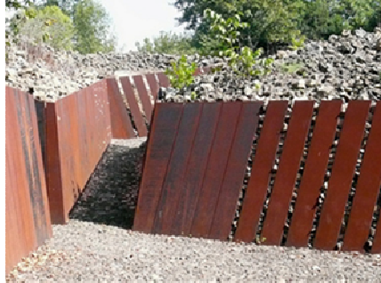
Fig.3. Acceso al parque. RCR architectes, Les Preses, 2002.

Al mismo tiempo recuperan la actividad agrícola que le dio el origen identitario. Pero lo hacen igualmente reinventando, incorporando los cultivos de especies autóctonas en peligro de extinción en la comarca como beneficio ambiental y pedagógico en lugar de productivo.