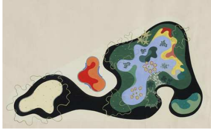
Fig.1. Plano de la Plaza Sáenz Peña, Río de Janeiro, Brasil, 1948. Roberto Burle Marx.

como el brasileño Roberto Burle Marx con los que se introduciría una visión moderna de los paisajes potenciando la identidad de los mismos 6 .