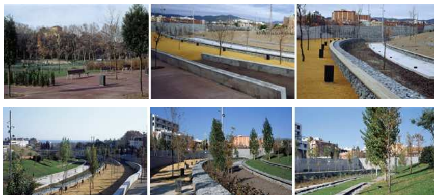
Fig.8-13. Diversas vistas del parque. Isabel Benassar, Badalona, 1999.

Pero seguramente su logro más importante sea la creación de una nueva topografía. A base de terrazas, muretes y rampas, la denostada riera tiene un nuevo perfil, una nueva identidad para sus ciudadanos, un nuevo relieve, que basado en otro anterior desaparecido, consigue entrelazar el tejido urbano dotándolo de una reinventada zona verde lineal.