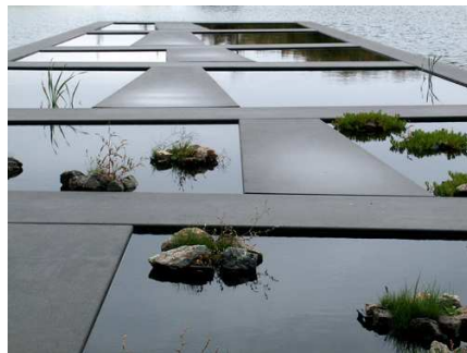
Fig. 18. Zona de las plantas acuáticas. Mosbach paysagistes, Burdeos, 2002.

Mosbach materializa el nuevo jardín botánico organizando los grandes grupos mostrados de especies, mediante un claro factor agrícola o de cultivo. En todos ellos acota los espacios de exposición a parcelas con diferentes geometrías, declarando que se trata de plantaciones antropizadas y reinventadas.