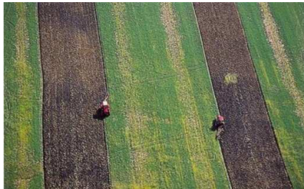
Fig.17. Tractores arando en el oeste del estado de Ohio, Estados Unidos.

Si la climatología y la topografía se pueden considerar los factores primigenios en la relación que se establece entre paisaje y habitante, estos agentes tienen una condición originaria natural –más allá de los procesos posteriores que se derivan de ellos- que los factores agrícolas y ganaderos necesitan de un trascurso de antropización para alcanzarlos.