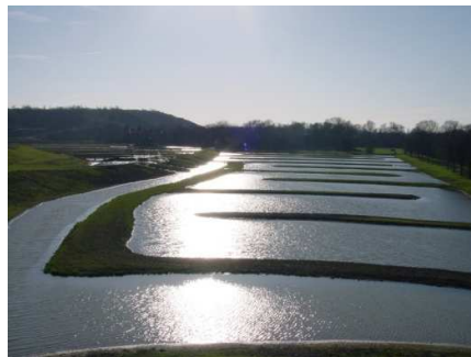
Fig.15. Las nuevas lagunas. Paysages, Harnes, 2004.

Utilizando un factor climático como herramienta proyectual, las lagunas de Harnes, consiste en la recuperación de un medio originario húmedo de aguas superficiales. Pero el proyecto va más allá, además de devolver la identidad acuática del lugar, utiliza el agua proveniente de una depuradora cercana para acabar, mediante el sistema de lagunas, con su depuración natural hasta llegar a la última balsa que es apta para el baño. Uniendo de esta forma el nuevo paisaje con su tiempo social y aprovechando la transformación para enriquecerlo.