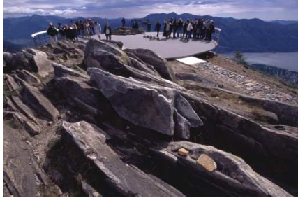
Fig. 4. Mirador en la montaña de Cardada. Paolo L. Bürgui, Suiza, 2000.

Bürgui aprovecha la ocasión presentada para reinventar la montaña, a base de exponer sus valores identitarios con una nueva lectura del lugar, consiguiendo hacer visible un paisaje que aún en buen estado permanecía alejado e inaccesible.