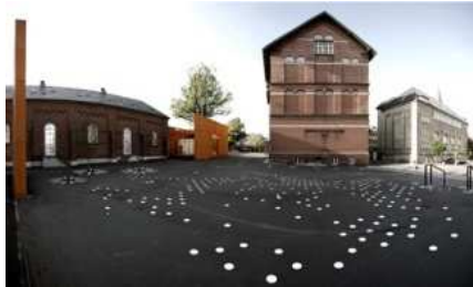
Fig.22. Patio del centro Nicloi. Kristine Jensen, Dinamarca, 2007.

La oportunidad de la reconversión del conjunto en un espacio cultural emergente multidisciplinar, posibilitó la creación de un nuevo patio que aglutinase las nuevas funciones a la vez que creara una nueva relación con los usuarios.