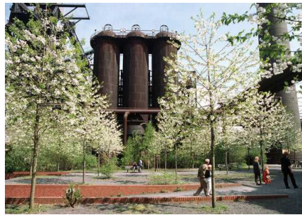
Fig.21. Reutilización de las infraestructuras. Latz & Partner, Alemania, 2000.

Las construcciones técnicas y de ingeniería existentes, no sólo se mantienen, sino que se vuelven elementos paisajísticos, considerados casi como objetos de land art , pasando a ser los protagonistas del parque; estructuras que, reinterpretadas, otorgan una nueva identidad al lugar. Los objetos, más allá de ser elementos artísticos, se reutilizan para dar cabida a la cultura y el deporte.