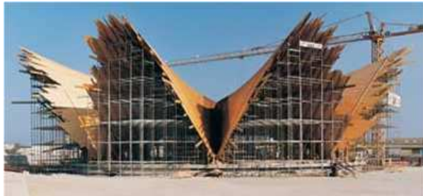
Figura 4. Cubierta del restaurante submarino de L'Oceanogràfic sito en la Ciudad de las Ciencias y las Artes. La planta del edificio es octogonal y su cubierta de hormigón presenta ocho lóbulos con simetría radial que le dan una forma de roseta. Cada lóbulo y su opuesto forman parte de un mismo paraboloides hiperbólico.

sólo salió según lo previsto sino que las deformaciones fueros prácticamente nulas, coincidiendo así con los resultados de cálculo.