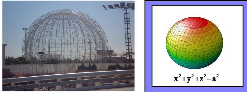
Figura 2. Edificio Humedales de forma esférica sito en la Ciudad de las Ciencias y las Artes de Valencia.

óptimo. De todos los sólidos de un volumen dado, la esfera es el que tiene una superficie de menor área (propiedad isoperimétrica); de todos los sólidos con un área superficial dada, la esfera es la que encierra el mayor volumen. Estas dos propiedades (cada una de las cuales implica la otra) define de forma única a la esfera.