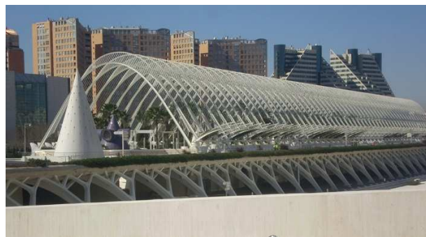
Figura 3. L'Umbracle, sito en la Ciudad de las Ciencias y las Artes de Valencia. Su forma responde a un cilindro parabólico.

- L'Umbracle (Fig. 3), situado en la Ciudad de las Ciencias y las Artes. La cuádrica que podemos identificar fácilmente es un cilindro parabólico. L'Umbracle es la "puerta principal de acceso" a la Ciudad de las Ciencias y las Artes.