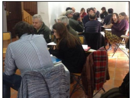
Figura 3: Participantes en el taller participativo de Altea.

En el Exp. EATE se hace referencias a consultas y entrevistas, pero sin indicar a que actores van dirigidas. Ya en la DATE se señalan las administraciones que respondieron tras las consultas realizadas en la Fase 2: