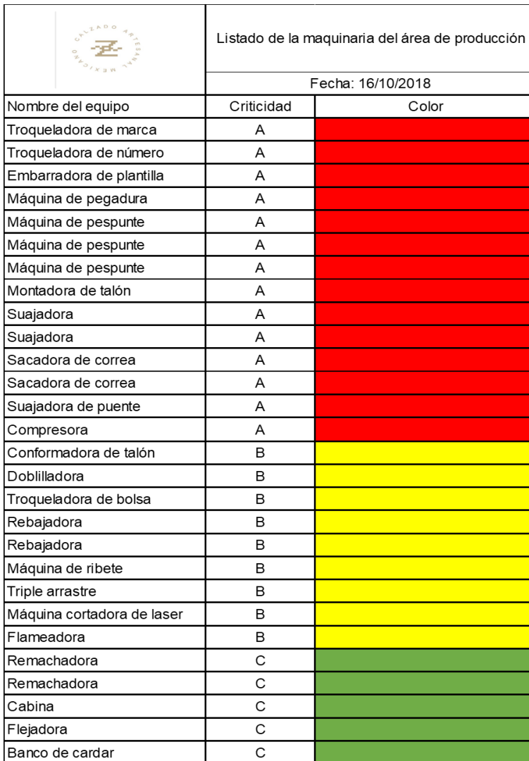
Tabla 4. Resumen del Análisis de Criticidad