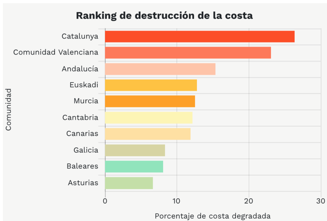
Gráfico 1. Porcentaje de costa degradada según comunidades

La destrucción del suelo en las zonas de costa no es equitativa en todo el litoral español, sino que se concentra en determinadas zonas, siendo éstas terreno muy propenso a acoger turistas en los meses estivales.