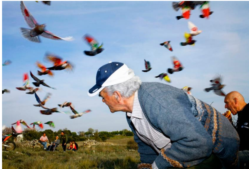
Ilustración 4. Paloma al aire, Ricardo Cases (2011)

“Cada vez que dispara tiene claro cuál es el objeto de su interés y jamás se le vio hacer una foto vacía (...) y con la soltura que da el oficio se manifiesta en libertad otro de sus rasgos: el humor. Sin poder evitarlo, en sus retratos y reportajes aflora un punto de vista irónico y subversivo” (López Navarro, 2012: p.7)