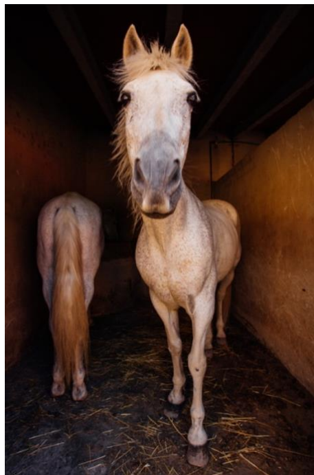
Ilustración 11. Antes del retoque con Lightroom Ilustración 12. Después del retoque con Lightroom