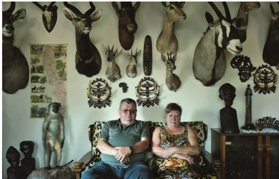
Ilustración 9. Frame de la película “In The Basement”, Ulrich Seidl (2015)

Por último, y como referente cinematográfico, es Ulrich Seidl. Lo destacable de Seidl es la disposición de los sujetos dentro del plano, como con un solo frame describe y retrata el ambiente y la personalidad de los personajes.