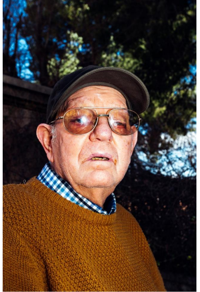
Ilustración 20. “El Roig” , 2020.