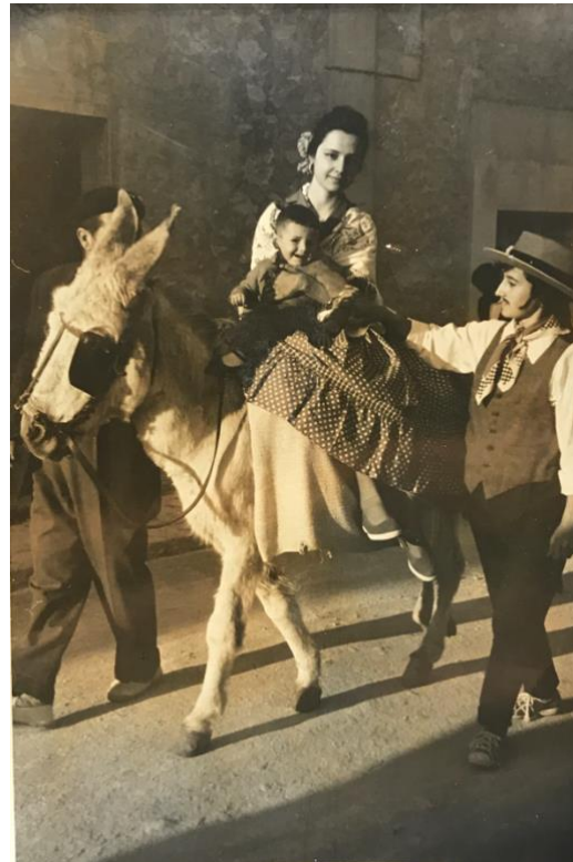
Ilustración 1. Sin título, Aniceto Martínez Galiana (1965)

Además, desde pequeño he formado parte del entorno rural y la economía agraria de La Romana. He llevado a cabo tareas dentro del sector de la