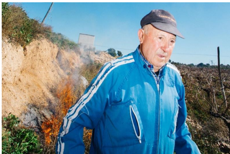
Ilustración 23. Quema de viñedo, 2020.