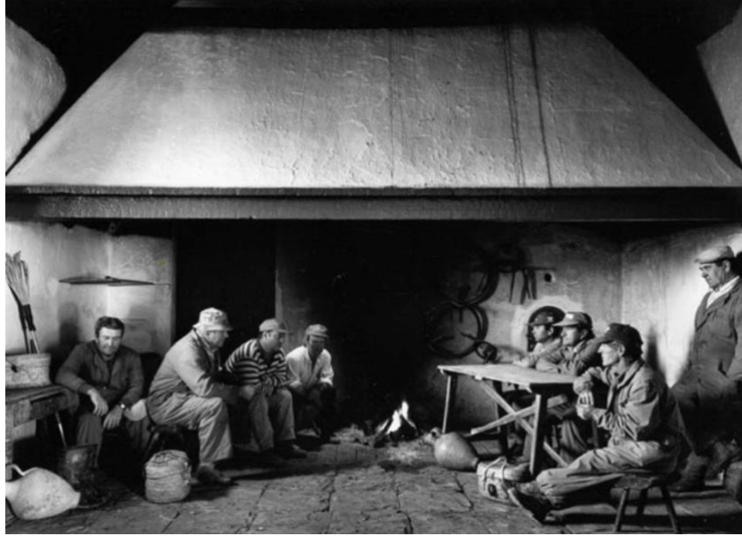
Ilustración 5. Trabajadores, Atín Aya (2001)

Su hija, María Aya, lleva a cabo un análisis de lo que se consideraría esencial dentro del material visual ofrecido por Atín Aya: