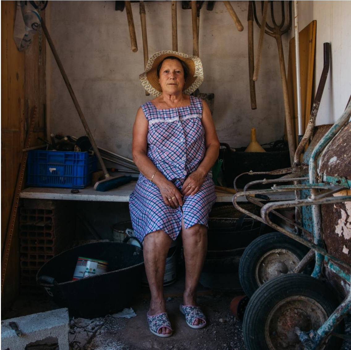
Ilustración 15. Consuelito, 2020.