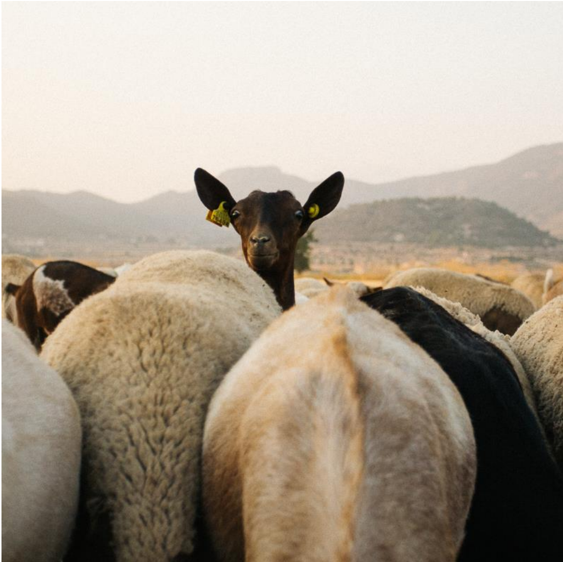
Ilustración 14. Delirio, 2020.