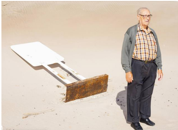
Ilustración 3. Fotografía incluida en el Porque de las naranjas, Ricardo Cases (2014)

Me interesé por Ricardo Cases debido a la utilización de elementos claves identitarios que conforman la zona alicantina. Ricardo Cases se le ha reconocido como una figura esencial para la fotografía contemporánea española. Su uso continuo del flash y la saturación de los colores que conforman el paisaje o los elementos a retratar son características de su estilo propio.