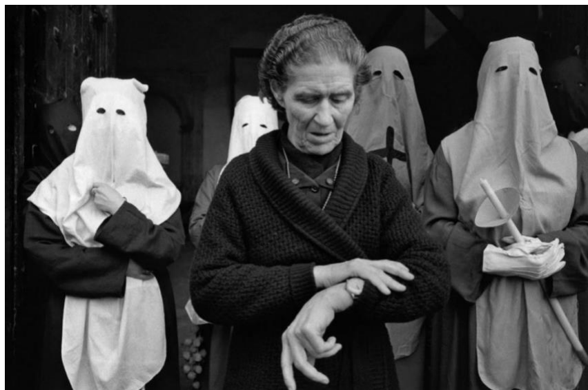
Ilustración 6. Obra dentro del fotolibro España oculta, Cristina García Rodero (1989)

Además, Rodero estipula su interés por los rituales y celebraciones donde la cultura y elementos identitarios nacionales destacan: “Las celebraciones que más me interesan son las rituales, porque en los ritos es donde se manifiesta de una forma más rica y profunda el espíritu de un pueblo” (2012: p.3)