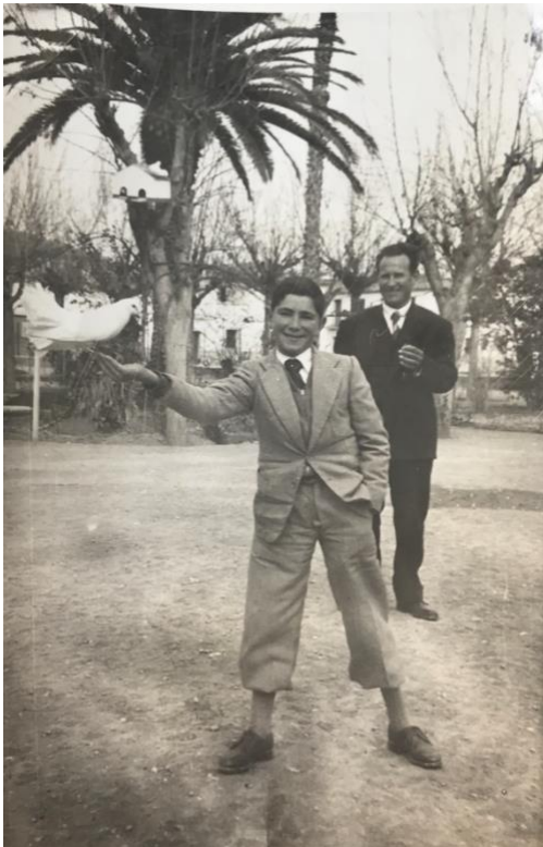
Ilustración 2. Sin título, Aniceto Martínez Galiana (1954)

Mi vinculación con la fotografía está relacionada con mi abuelo, que a los 40 años se adentró en ella y se encargó de retratar a su familia y festividades que se llevaban a cabo en el pueblo; a los 60 años tuvo que dejar la fotografía por la pérdida de la visión en un ojo. Ahora y con este proyecto, se pretende seguir su trayectoria fotográfica por lo que repercute a la forma de retratar el ambiente pueblerino.