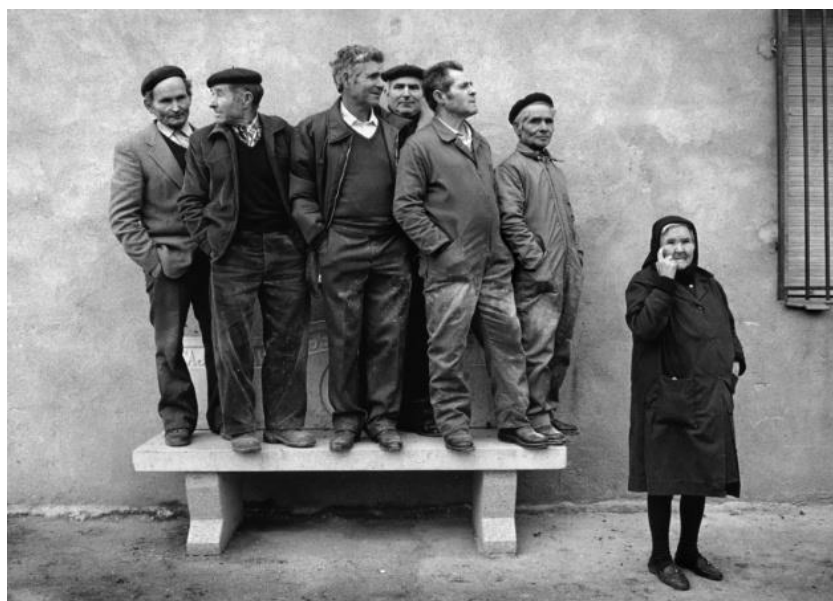
Ilustración 7. Fotografía en La España oculta, de Cristina García Rodero (1964)

Se servirá de su imagen visual como ejercicio para analizar aquellas características festivas que caracterizan al componente local del pequeño municipio de La Romana.