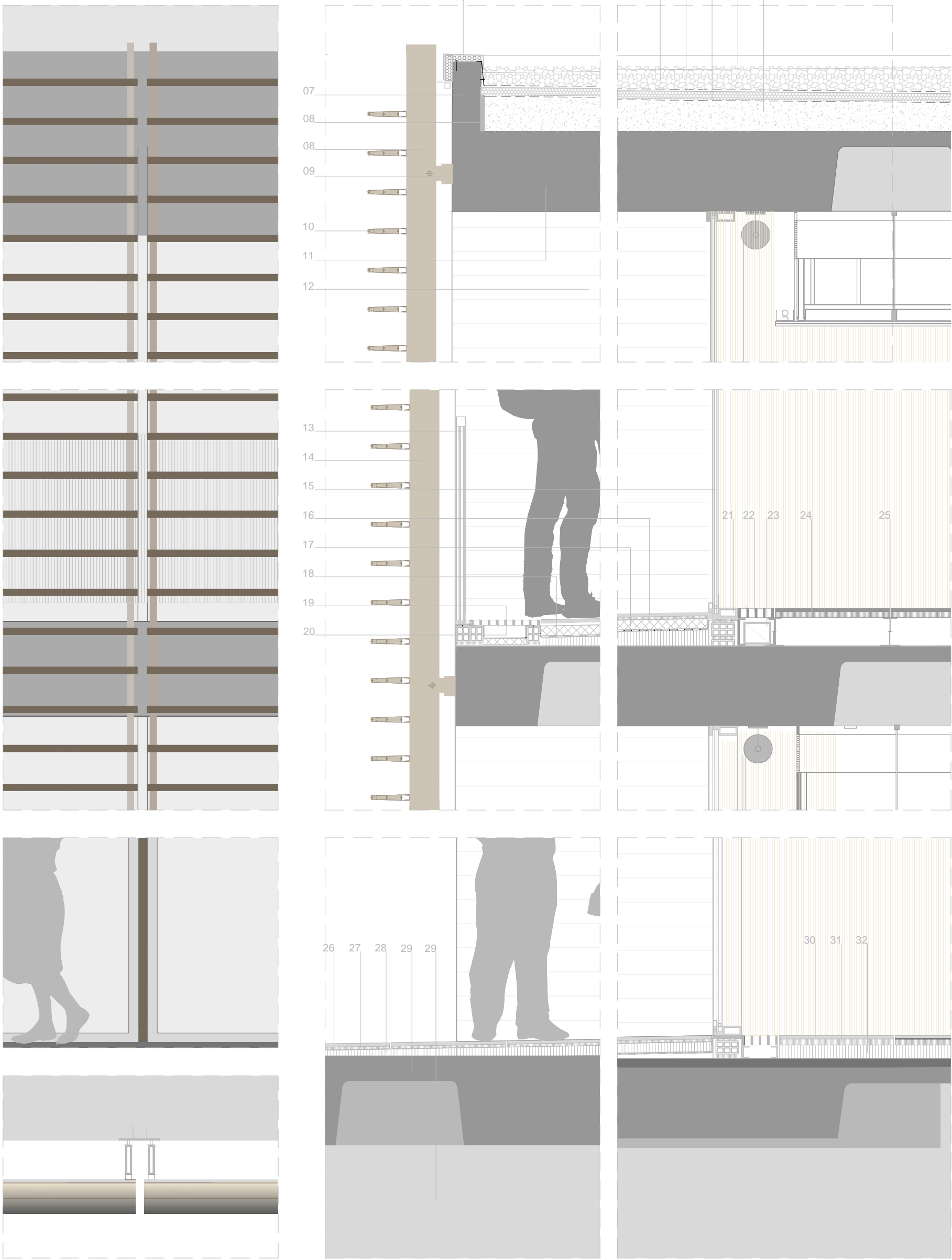
Detall façana Sud E:1/20

01 Grava arrodonida 02 Panells de poliestirè extrusionat de 60mm 03 làmina impermeable asfàtica amb geotèxtil de protecció 04 fratast superficial del formigó 05 formigó alleugerit per a formació de pendents 06 Coronació de protecció del muret perimetral de la coberta (xapa d'acer 4mm) 07 Muret perimetral de coberta executat en formigó armat 08 Montant vertical lames 09 Peça de sujeció del montat vertical soldada a pletina formigonada en el cantell del forjat 10 lama horitzontal revestida de coure 11 forjat bidireccional alleugerat de casellons 12 Pilar estructural de formigó 40x40 13 barandilla metàl·lica 14 montat metàl·lic 15 Vidre Climait tancament exterior 16 Paviment filtrant 17 Panells de poliestirè 18 Formigó alleugerit per formar pendents 19 Canalo arrellegada d'aigües 20 Arrellegada d'aigües 21 Perfil acer galvanitzat carpinteria exterior embegut en el sol 22 Reixeta retorn 23 Tub retorn 24 Paviment flotant casa Tecnal 25 Suport paviment flotant 26 Paviment Terratzo exterior 27 Morter d'agare 28 Formigó de pendents 29 Impermeabilitzat 30 Forjat estructural 31 Aparcament 32 Paviment STON-KER de Porcelanosa 33 Ciment d'agare