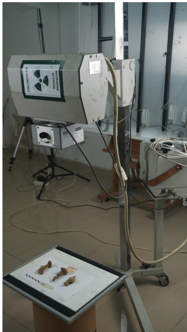
Figura 3. Proceso de toma de radiografías.

combina con el programa de identificación de imágenes y control de calidad AGFA® NX.