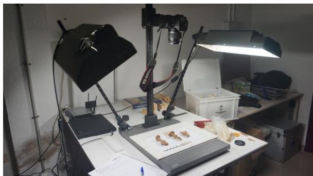
Figura 2. Proceso de toma de imágenes en una mesa de reproducción Kaiser® RS10 Copy Stand.

radiográfica. La plancha contaba con un sistema de escala y las referencias de siglado. Dependiendo del tamaño de cada una de las piezas, e intentando seguir el su siglado, los 193 objetos se han distribuido en 32 conjuntos. Este sistema de montaje permite la reproducción de los conjuntos examinados en similares condiciones.