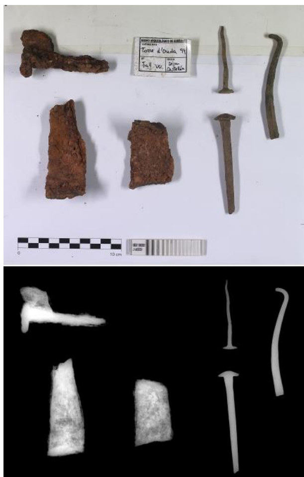
Figura 4. Comparativa entre visible e imagen radiográfica del registro 896.