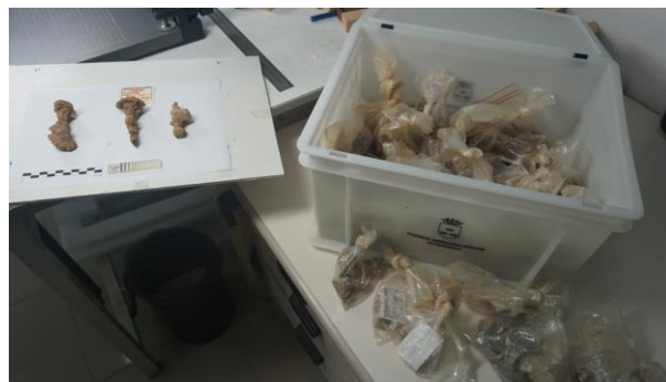
Figura 1. Lote de piezas que han sido caso de estudio.

El conjunto objeto de estudio está compuesto, casi en su totalidad, por objetos de hierro más una pequeña muestra de piezas de bronce y restos de plomo, que presentan distintos estados de conservación (fig.1).