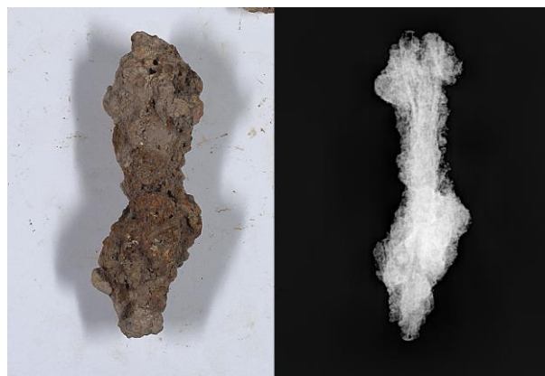
Figura 7. Pieza TO - 108, comparativa entre imagen visible y su imagen radiográfica.

Dentro de este rango se sitúan piezas como TO - 154, TO - 126, o la TO - 78. Dentro de este conjunto se encuentra la TO - 108, recogida en el registro 910, que es un buen ejemplo de lo que este rango representa (fig.7). Esta es un claro ejemplo de pérdida de núcleo metálico, deformaciones, elevado nivel de productos de corrosión, así como multitud de fisuras y fracturas.