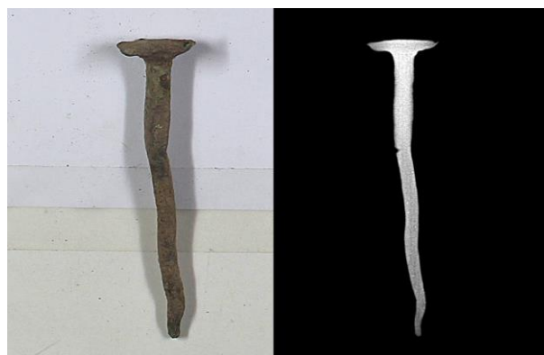
Figura 5. Pieza TO - 16, comparativa entre imagen visible y su imagen radiográfica.

El informe reportado de esta consulta marca un rango de valores entre 5 y 20. De esta forma, este listado nos muestra la pieza por un lado las de mayor valor, donde destacan la pieza registrada con la referencia TO - 16 (fig.5) y la TO - 122 con un valor de 16, frente a las de menor valor como TO - 78 y TO - 126 con un valor asignado de 6. Las piezas con elevado valor numérico muestran una forma identificable y su estado de conservación es bueno, frente a las piezas de menor valor que son fragmentos totalmente mineralizados que han perdido todo su núcleo metálico y no presentan una forma definida.