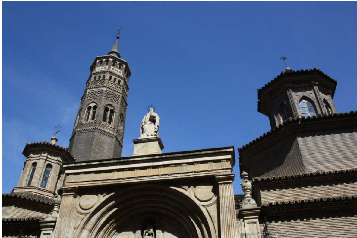
Fig. 2 Exterior de la iglesia y torre de San Pablo

En la actualidad podemos decir que se trata de un conjunto extraordinario, donde se unen diferentes estilos artísticos y elementos patrimoniales de gran relevancia. Entre ellos destaca su arquitectura mudéjar con la torre como gran emblema al tratarse de uno de los ejemplos más antiguos de este estilo en España (Fig. 2). Su antigüedad e influencia en la arquitectura mudéjar posterior fue uno de los motivos clave para su declaración como Patrimonio Mundial.