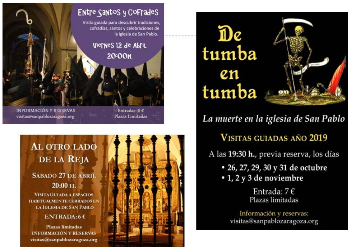
Fig. 4 Visitas especiales en la iglesia de San Pablo

Además, se han creado una serie de visitas especiales para grupos y visitas más específicas que exploran aspectos singulares de la parroquia. Las visitas especiales o “Premium” (Fig. 4) se realizan a lo largo de todo el año de forma puntual y son las siguientes: