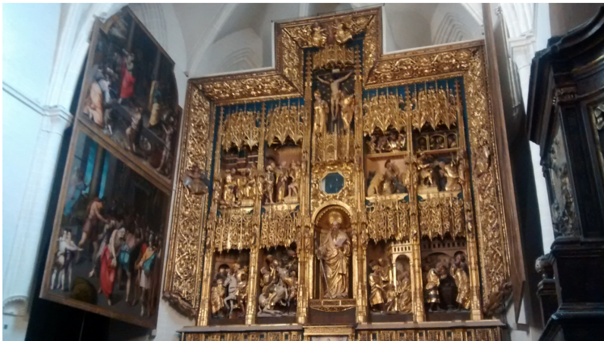
Fig. 3 Retablo Mayor de Damían Forment (s. XVI)

degradación social y urbanística, hizo que el templo fuera casi olvidado. Afortunadamente desde finales de los 90 se están desarrollando diferentes intervenciones de carácter social y urbanístico que están permitiendo, en mayor o menor medida, la reversión de estas problemáticas en la zona. La iglesia de San Pablo por su extraordinario valor patrimonial, tradición e historia debe obligatoriamente constituirse como un verdadero motor para favorecer la recuperación social, urbanística y económica del barrio.