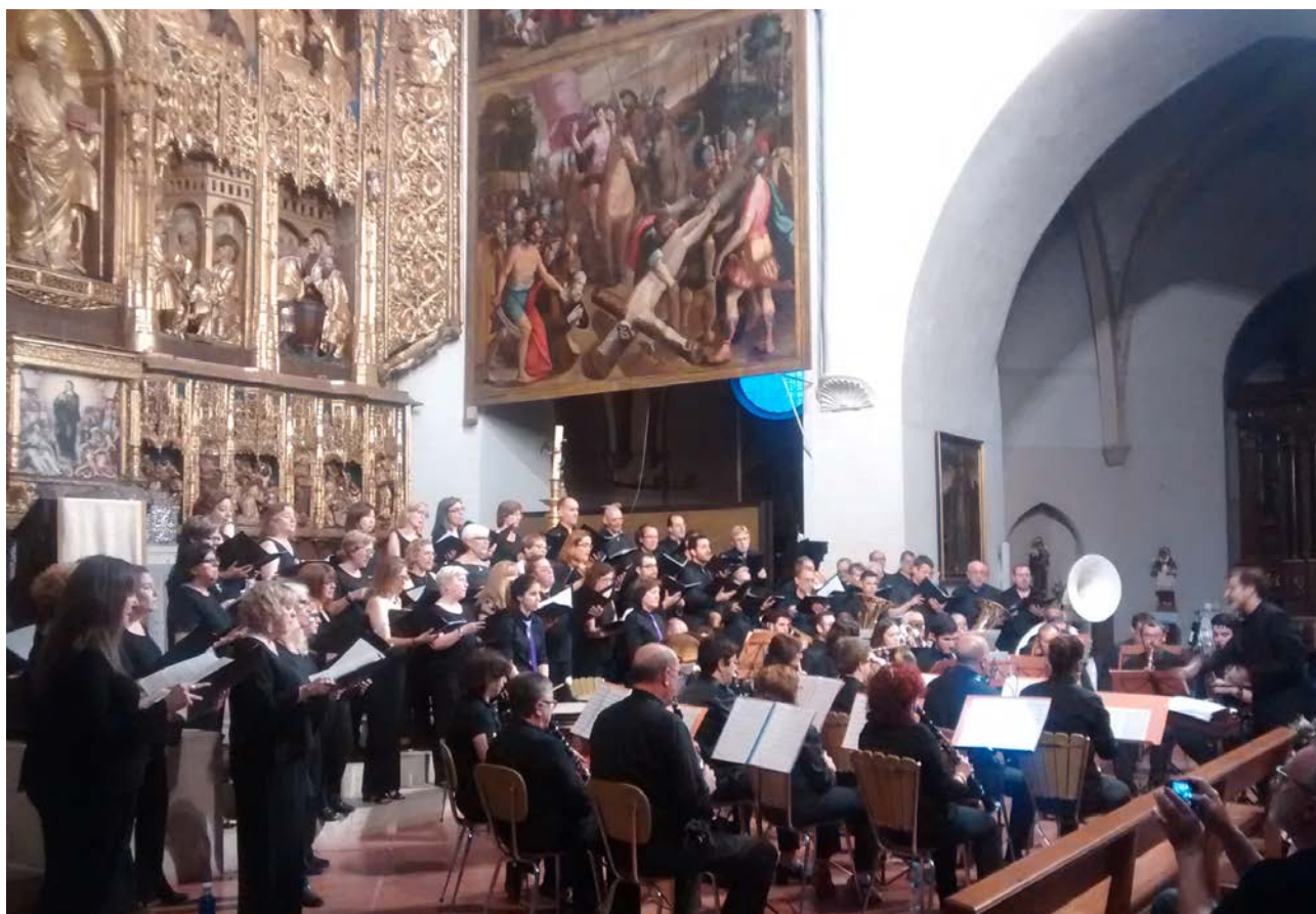
Fig. 5 Concierto en la nave mayor de la iglesia

En el plan de dinamización de la iglesia de San Pablo también hay que resaltar la apertura del templo a la realización de conciertos a lo largo del año. La buena acogida por parte del público de este tipo de actividades ha convertido a San Pablo en los últimos años en una referencia musical en la ciudad de Zaragoza. En el año 2019, por ejemplo, se han llegado a realizar 18 conciertos de diferentes tipos de música (Fig. 5).