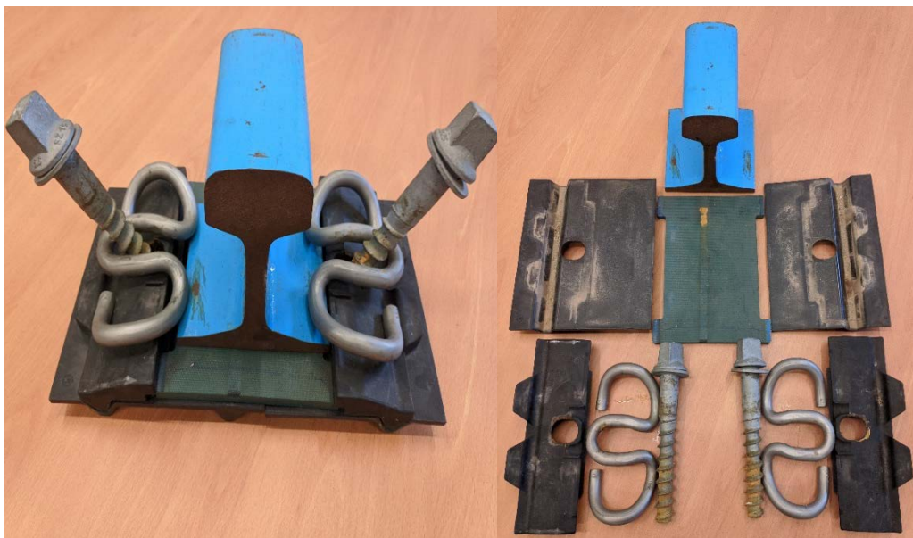
Figura 4. Vista de una sujeción y sus componentes.