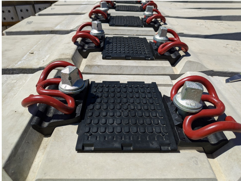
Figura 1. Vista de una sujeción tipo clip