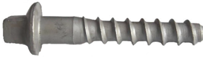
Figura 2. Vista de un tirafondo.