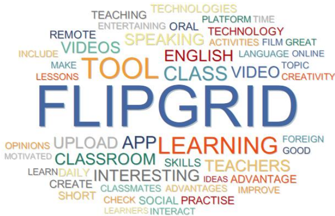
Figura 1. Nube de palabras de las respuestas sobre las ventajas de Flipgrid.

En las figuras 1 y 2 pueden observarse las nubes de ideas de las respuestas sobre los aspectos positivos y negativos de Flipgrid. En la Figura 1 (ventajas) los términos más frecuentes son Flipgrid, tool, learning, class, app, classroom, English, videos, interesting y speaking. En la Figura 2 (limitaciones) las palabras más repetidas son students, app, bit, disadvantage, slow, tool, video, videos, feel, classroom y shy.