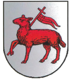
Escut dels Company, segons Garcia Garrafa.

En conjunt, la família Company, com altres del seu estil, va mostrar una gran adaptabilitat a un medi social revolucionat i inestable així com una gran capacitat per especialitzar i diversificar els camps d'acció dels seus membres. Tant la seua gènesi com la seua projecció i prestigi anaren molt més enllà de les dimensions locals. En qualsevol cas, és evident que no exhaurim ací les potencialitats de la investigació ni la curiositat pel saber. 54