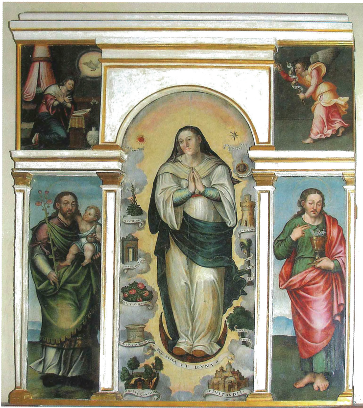
Fig. 1. Gaspar Requena. Retaule de la Puríssima. Església de la Mercè. Xàtiva

L'any 2000 Fernando Benito rebatejà a aquest pintor com a “Deixeble joanesc de Montesa” a partir del retaule de l'ermita de Sant Sebastià de Montesa, conservat actualment a l'església parroquial i datat l'any 1559. Aquest professor amplià el corpus d'obres en afegir, a les de Xàtiva citades, el retaule de Sant Jaume del museu parroquial de Bocairent, i les taules amb les escenes de la vida de sant Domènec –procedents d'un retaule del convent dominic de Llutxent– conservades al Museu de Belles Arts de València. Destacà la gran proximitat del pintor a Joanes, qui “fins i tot autoritzà copiar els seus models literalment” 3