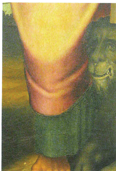
Fig. 10. Gaspar Requena. Detall de la taula de St. Lluç i St. Marc. Retaule de St. Jaume de Bocarent.

D'una part de la placa de vidre de sant Joaquim (fig. 14 i 15) s'obtingué el clixé per a la fotografia publicada per Sarthou. No obstant, el negatiu original mostra a més, a l'esquerra, part de la polsera on advertim la taula de sant Cristòfol (fig. 17) i part de la de santa Llúcia. Es possible a més apreciar petits detalls decoratius de la talla de fusteria. En la primera taula el sant gegant afona les cames fins als genolls en les aigües del riu i la mà esquerra sosté la gaiata amb forma de palmera. Sobre el muscle dret porta la fi-