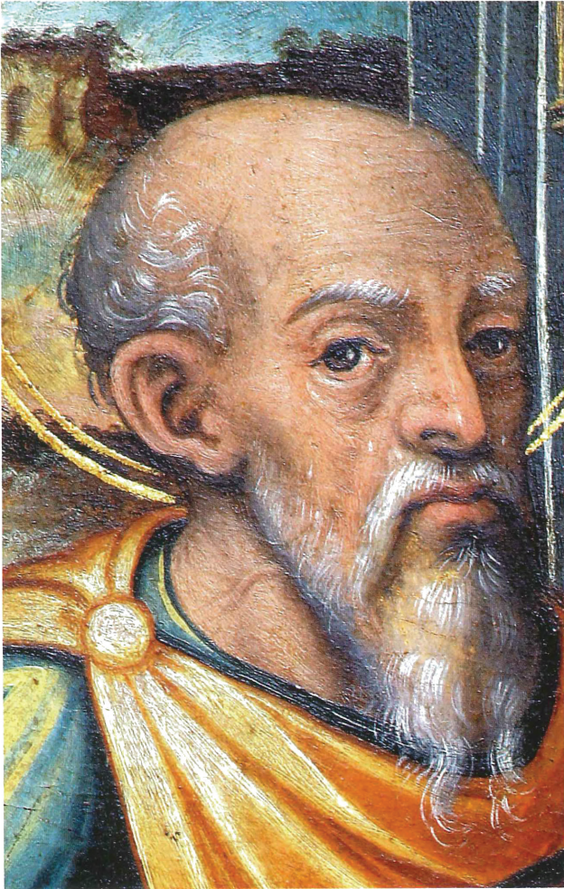
Fig. 13. Gaspar Requena. Apòstol del retaule de la Dormició. Institut de secundària Lluís Vives. València.

gura del Nen Jesús, el qual posa un braç sobre el cap de Cristòfol. Aquesta obra és semblant a una altra del pintor, del retaule de Sant Sebastià de Montesa, també en la polsera, si bé aquesta última està molt repintada malgrat la restauració. El sant Cristòfol de Xàtiva sembla directament inspirat en el que Joanes pintà per a la porta del retaule de les dominiques del Portal Fosc, de la mateixa ciutat. En el detall fragmentari de la taula de Santa Llúcia a penes és possible apreciar el braç, el mant i els peus.