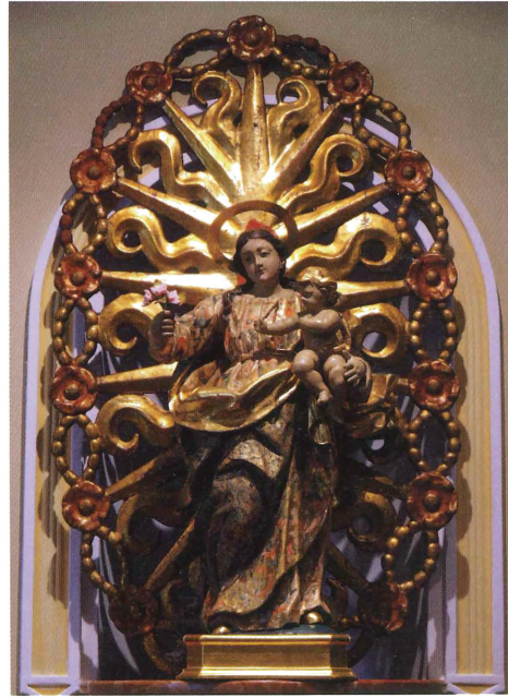
Fig. 8. Anvers amb una estàtua de la Mare de Déu. Escola Pia de Gandia.