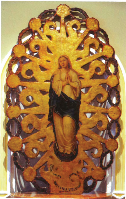
Fig. 5. Revers. Gaspar Requena. Puríssima. Escola Pia de Gandia

i daurada. Al centre veiem representada la Puríssima (fig. 5). La figura s'alça sobre un creixent lunar i té un filacteri amb la inscripció Pulchra ut luna . En realitat, es tracta del revers de l'aurèola d'una escultura processional de la Mare de Déu del Rosari, de manera que els extrems dels rajos esdevenen roses que enllacen els grans del rosari. 11 D'aquesta forma se sintetitzava en una sola imatge religiosa la devoció mariana dels dominics (Mare de Déu del Rosari) i la dels franciscans (Immaculada Concepció). La peça, conservada a la residència dels pares escolapis de Gandia, amida 96 x 56 cm. Aquesta tipologia d'imatge processional "bifront" que recollia ambdues advocacions de forma complementària fou habitual en l'època. Un cas semblant el trobem a l'església parroquial de Bocairent, en un dels petits retaules laterals del presbiteri, el dedicat a la Puríssima amb l'escut heràldic dels Mahiques. En aquest, resultat de la unió de restes de diversos retaules, la Immaculada també està pintada sobre una tau-