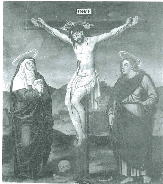
Fig. 18. Gaspar Requena. Calvari. Calvari Alt de Xàtiva.