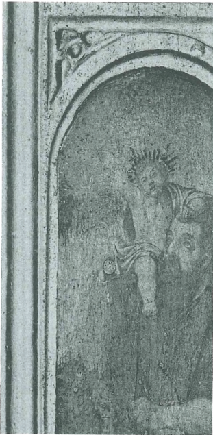
Fig. 17. Detall de sant Cristòfol. Retaule del Calvari Alt de Xàtiva.