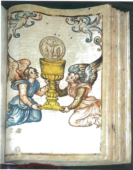
Fig. 3. Gaspar Requena. Llibre de la Il·luminària del Santíssim Sagrament, 1560. Museu de la Seu de Xàtiva

Més atribucions a Gaspar Requena han estat publicades per Lorenzo Hernández, qui a més, com ja establí Orellana, 6 ha reunificat en una sola persona Gaspar Requena el Vell i Gaspar Requena el Jove, donant-li una cronologia aproximada entre 1515-1520, any de naixement, i 1585, de defunció. Fins el moment s'havien atribuït a Cristòfol Llorens diverses obres que ara han estat restituïdes amb justícia a Gaspar Requena. 7