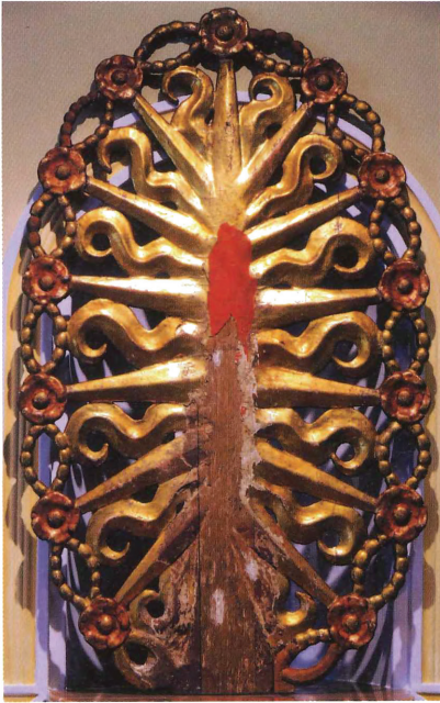
Fig. 7. Anvers de l'aurèola amb el rosari. Escola Pia de Gandia.