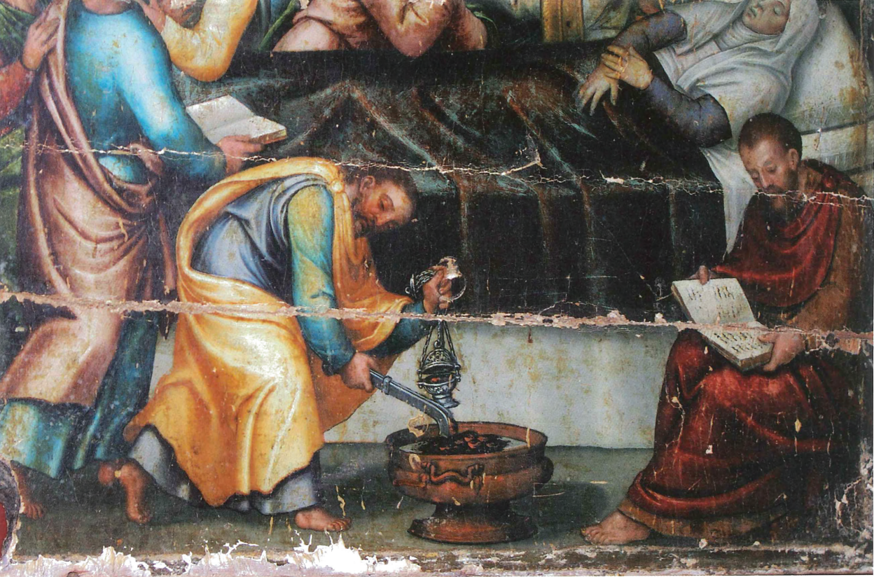
Fig. 4. Gaspar Requena. Taula de la Dormició. Església de Sta. Magdalena de l'Olleria

museu, i en l'actualitat es desconeix el parador. Té unes dimensions de 37 x 27 cm, per la qual cosa degué ser una de les taules laterals –del carrer esquerre, si tenim en compte l'orientació de la figura– de la predel·la d'un retaule de dimensions i arquitectura semblant al d'ànimes d'Agullent. La taula exterior del banc d'aquest retaule amida, sense marc, 35 x 31 cm, pràcticament la mateixa grandària que la taula de Dènia. Per altra part, hem de remarcar que l'estructura formal del retaule d'Agullent és molt del gust pel pintor. L'advocació jerònima estigué present a la comarca de la Marina des d'antic. Sant Jeroni és un sant molt representat al País Valencià durant l'Edat Mitjana i el Renaixement, amb la qual cosa resultaria complicat –més encara amb les escasses dades que tenim sobre l'obra– intentar situar-lo en un retaule o escenari concret. De moment no descartem, com a mera hipòtesi, que pogués tractar-se de l'última resta d'un antic retaule que tingueren els jurats a la capella de la Casa de la Ciutat. 10