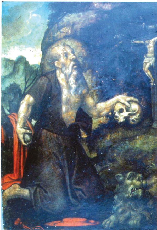
Fig. 9. Gaspar Requena. Sant Jeroni. Museu Arqueològic de Dènia.

va. 21 Tormo menciona que el fotògraf en realitzà també una del retaule sencer, la imatge del qual no hem localitzat a l'arxiu.