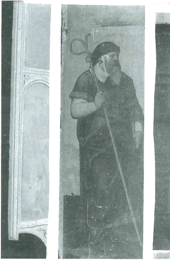
Fig. 14. Gaspar Requena. Sant Joaquim. Retaule del Calvari Alt de Xàtiva.