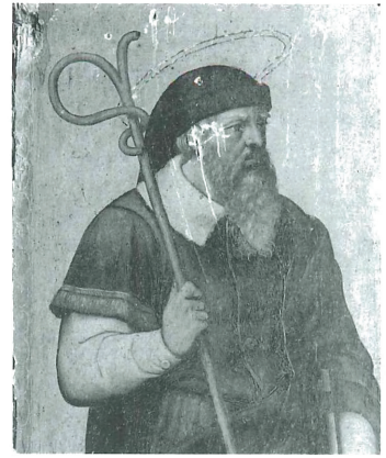
Fig. 15. Detall de sant Joaquim.