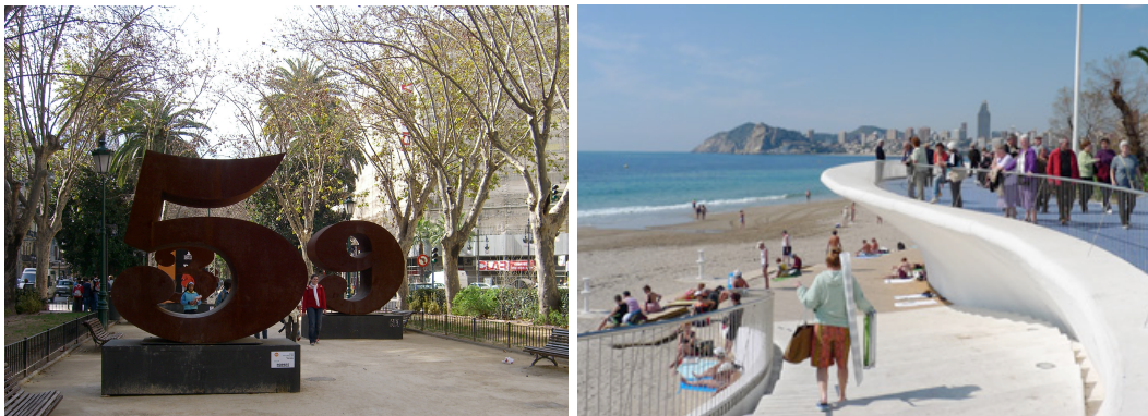
Imagen 1. El espacio público está constituido por el conjunto de calles, plazas, avenidas, paseos, etc. que configuran las ciudades. Utilizado comúnmente como vías de tránsito también constituyen, desde siempre, entornos adecuados para la práctica de actividades lúdica-recreativas, sociales y culturales, que fomentan la participación e implicación del usuario.

Se constituyen de este modo, como lugares de relación y de identificación, espacios en los que la vida social e institucional constituyen un factor relevante en su diseño, en los que se definen elementos propios, que diferencian y caracterizan una parte o el conjunto de una ciudad o de un entorno natural.