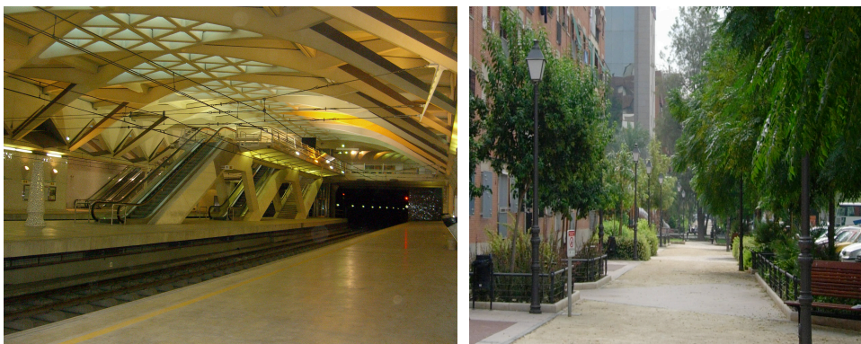
Imagen 2. Las estaciones de metro y los jardines públicos constituyen dos tipologías diferenciadas de espacios públicos.

En este contexto, un conjunto multidisciplinar de factores confluyen en la comprensión de este espacio, entre los que cabe destacar la ergonomía, el diseño, la arquitectura, el paisajismo, la planificación urbana, la gestión ambiental, la ingeniería y ecología ambiental, la antropología urbana, la geografía humana y social, la sociología ambiental y la psicología ambiental. Aspectos todos ellos que diferencian y constituyen el carácter del espacio público.