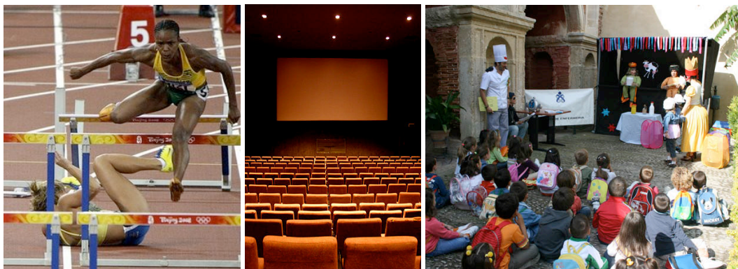
Imagen 3. Estadios deportivos, salas de proyección, aulas de formación, constituyen lugares considerados de pública concurrencia.

En este grupo, nos encontramos con una gran variedad tipológica de espacios y entornos que albergan heterogéneas actividades vinculadas con diferentes aspectos del ocio, (centros comerciales, cines, teatros, auditorios, estadios deportivos,...), lugares de reunión (salas de conferencias y congresos, bares, cafeterías y restaurantes, museos, parking, clubes sociales y deportivos...), las comunicaciones, la sanidad (centros hospitalarios, ambulatorios, sanatorios,...), actividades productivas (oficinas, recintos feriales, centros de trabajo,...) y centros de enseñanza (guarderías, colegios, institutos, universidades, bibliotecas,...).