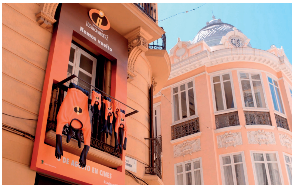
Fig. 3. “Un balcón increíble”, acción publicitaria para Los increíbles 2 en Málaga.

En cuanto a marketing promocional, puede mencionarse una acción vinculada al lanzamiento de Buscando a Nemo ( Finding Nemo , Andrew Stanton, 2003). Se crearon stands en los que se distribuían bolsas de plástico llenas de agua con el logo de la película (Fig. 4). La idea es tremendamente sutil e inteligente: si Nemo no está, las bolsas de peces no contienen