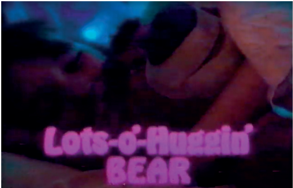
Fig. 5. Fotograma de Lots-o'-Huggin' Bear Commercial (circa 1983), contenido vinculado a Toy Story 3 .