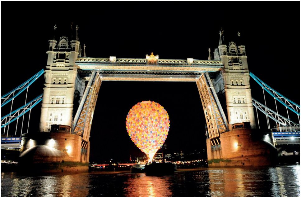
Fig. 2. Acción publicitaria para Up en el Tower Bridge de Londres.

aspecto común del cine de animación es la ilusión de realidad: “Hablar de animación es hablar de una serie de técnicas diversas que logran crear una ilusión de realidad —o una plausible y orgánica irrealidad— a través del artificio” (2010: 15). 12 De hecho, uno de los textos clave sobre el cine de animación, escrito por Frank Thomas y Ollie Johnston, míticos animadores de Disney, lo definía como “ilusión de vida” (Thomas, Johnston, 1981). 13 En efecto, realidad y ficción son elementos clave en la propia definición del cine de animación, hasta el punto de que, para diferenciarlo de las películas con actores de carne y hueso llamamos a estas “cine de imagen real”.