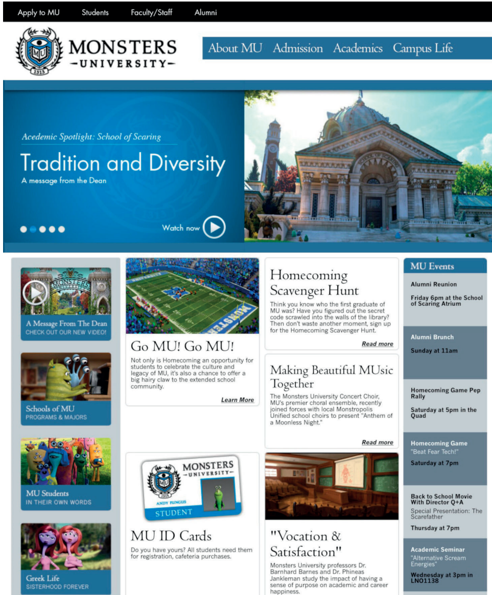
Fig. 6. "Homepage" de la web de la Monsters University, contenido vinculado a Monstruos University .