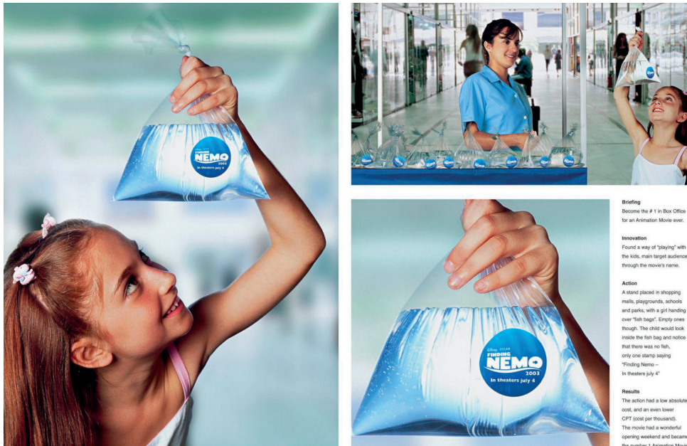
Fig. 4. Acción publicitaria para Buscando a Nemo .

WALL-E (Andrew Stanton, 2008). 14 No se trataba de una web oficial de la película, sino de la compañía, sin aparente conexión con el filme de Pixar. La web jugaba a la verosimilitud hasta extremos insospechados, con una estructura extraordinariamente amplia y compleja para ser algo totalmente ficticio, y sus secciones eran las habituales en una web corporativa: información corporativa, noticias, etc., y hasta una tienda —que era una tienda real a través de Zazzle.com en la que, de hecho, se podían adquirir productos de Buy n Large—. La falsa web fue un gran éxito viral que, además, jugaba con los mensajes centrales de la película. Por ejemplo, incluía anuncios de Xanadou, una pastilla que prometía simular una “experiencia eufórica de compra”; y su política de privacidad indicaba que, al acceder a la web, el usuario quedaba registrado en la base de datos de Buy n Large, de la que nunca podría darse de baja. Hay que tener en cuenta la gran audacia de esta propuesta