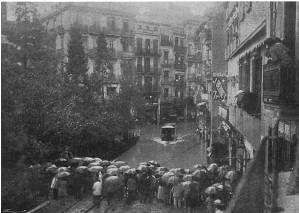
Fig. 4 Tranvía de caballos de la Sociedad Valenciana de Tranvías Prácticamente navegando en la Bajada de San Francisco en Valencia.

produjo una segunda avenida, que además vino acompañada de una fuerte tormenta matutina y lluvia torrencial y ya, a mediodía del día 9 cayó sobre Valencia un aguacero tan copioso que fue el anuncio de la gran riada que vendría al día siguiente, a partir de las 7 de la mañana, y que alcanzaría su pico de máximo caudal en la ciudad a las 11 horas, cuando el agua rebasó los pretilos en varios puntos y produjo numerosas víctimas y cuantiosos daños materiales. En muchas zonas de la ciudad y particularmente en las partes bajas del centro hubo serias inundaciones (véanse Figuras 4 y 5).