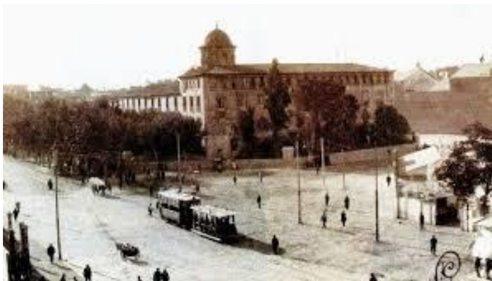
Fig. 3 El Instituto Provincial de Valencia