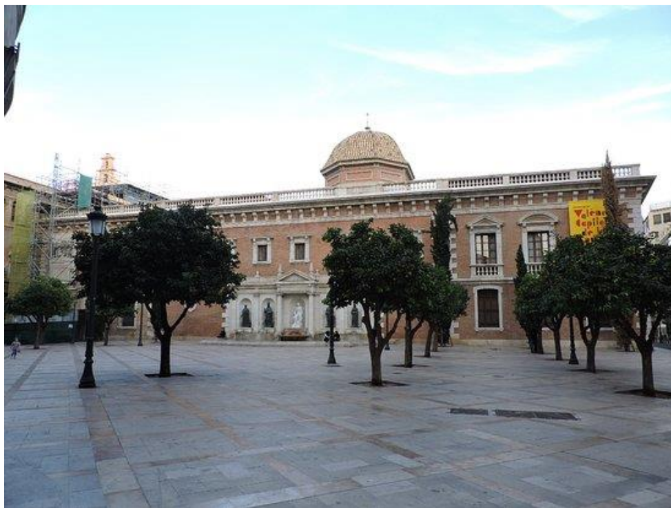
Fig. 1 La antigua Universidad de Valencia.