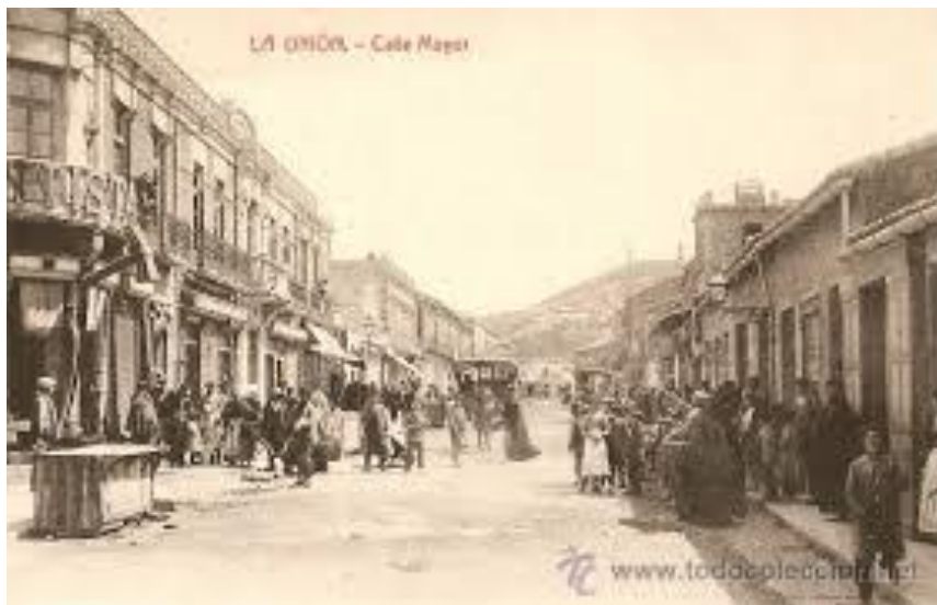
Fig. 2 Imagen de La Unión en 1860.