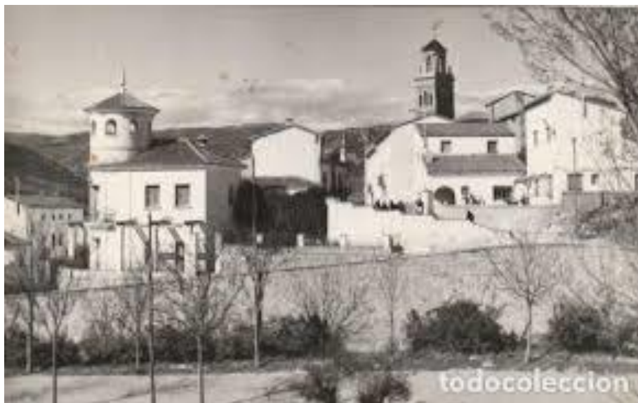
Fig.8 La localidad de Teresa en Castellón.