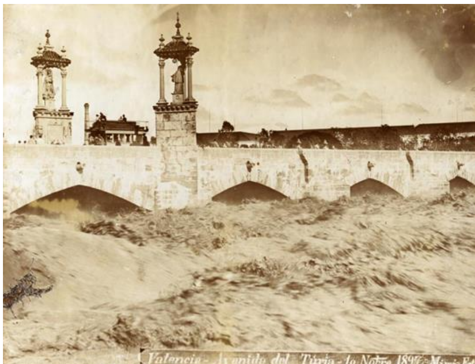
Fig.54 Tranvía de caballos tipo imperial cruzando el puente del Mar sobre el río Turia a punto de desbordarse.