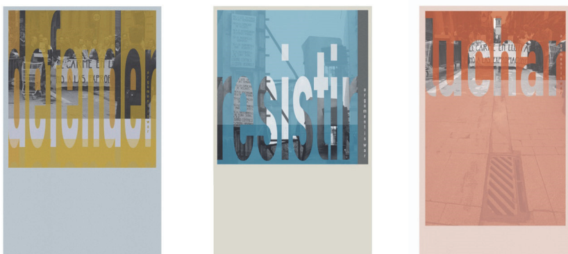
Figura 2. Investigaciones paralelas al proyecto (E)SPECULA(R): difusiones alternativas (carteles)

En una fase muy inicial -campo de escucha- del proyecto propuesto por los comisarios, durante una conversación con los representantes de la asociación de los afectados por el Pepri de la muralla Árabe me dijeron: “Mira, haced lo queráis con esto (refiriéndose al Proyecto), haced lo que os parezca, pero a nosotros lo que nos importa es que quede algo, por favor que quede algo.”