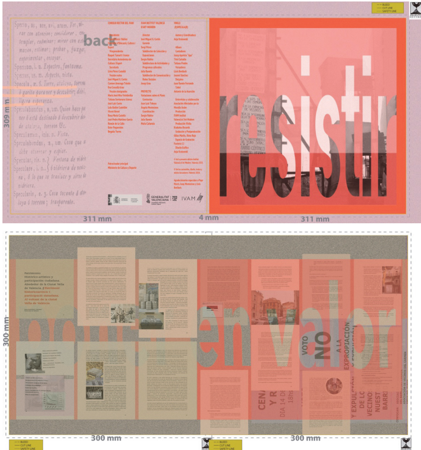
Figuras 4 y 5. Diseño gráfico/artwork del Vinilo (E)SPECULA(R): portada/contraportada; insert