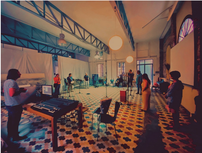
Figura 3. Grabación Vinilo

La versión final del master conjuga una selección de 11 Albaes con 30 minutos de grabación de fragmentos de las entrevistas que condujimos con la asociación. La duración de los contenidos viene condicionada por el formato en vinilo 33 RPM al que se optó y que establece un máximo-óptimo de grabación de aproximadamente 25 minutos por cada cara del disco. El diseño gráfico de la portada y contraportada o artwork , así como el insert , es de nuestra autoría, pero se basa en material gráfico y contenidos que la asociación puso a nuestra disposición a lo largo del proceso del proyecto.