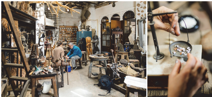
Figura 1. Investigaciones paralelas: activación del taller, aplicaciones de metalistería

Con todo ello, y no ahondando ahora en otros momentos de la historia más reciente del barrio, podemos constatar que las decisiones urbanísticas y patrimoniales -no pocas veces relacionadas con tendencias especulativas- que se han tomado y se siguen tomando, han alterado el tejido social de un modo brusco, habiéndose producido movimientos migratorios forzados (bien directamente por expropiaciones, por motivos económicos o por imposibilidad de desarrollar determinadas actividades económicas, resultantes estas últimas por el soterramiento de las fuentes de agua) de vecinos a otras partes de la ciudad.