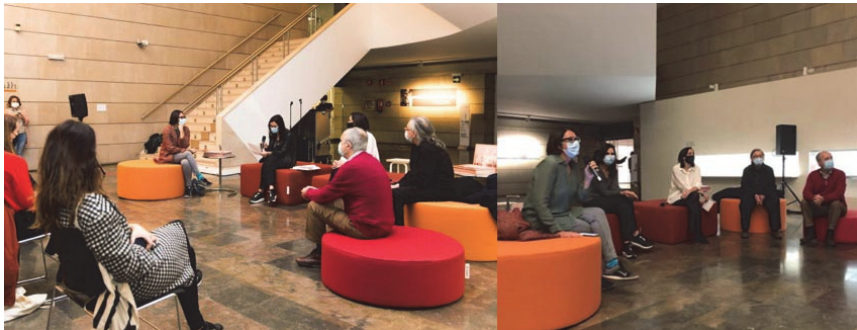
Figura 7. Presentación Vinilo IVAM, 2020

La versión definitiva del trabajo finalmente pudo ser presentada en el IVAM en diciembre del 2020. La presentación corrió a cargo de los responsables del proyecto y miembros de la asociación. Después de una explicación del proyecto por mi parte, se dio paso a una sesión de Albaes que versaban en una renovada versión sobre ciertos aspectos del patrimonio como espacio de disputa y también refiriéndose directamente al proyecto como tal.