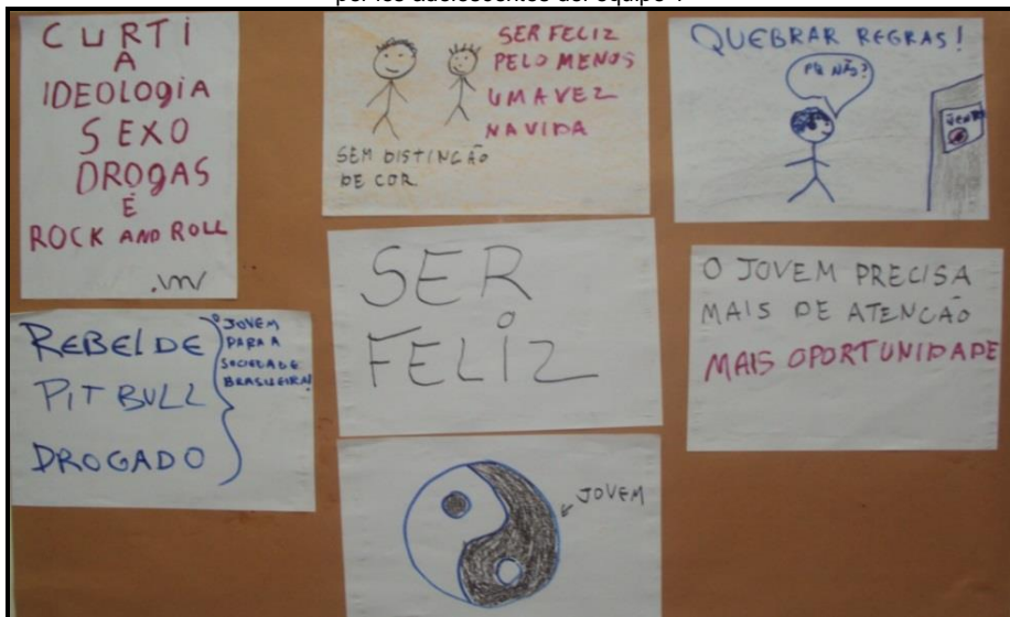
Fotografía 1. Cartel sobre el entendimiento de lo que es ser joven en la realidad brasilera elaborado por los adolescentes del equipo 1

El primer equipo presentó el siguiente cartel (Fotografía 1) con algunas frases, dibujos y símbolos, construidos a partir de un trabajo colectivo: