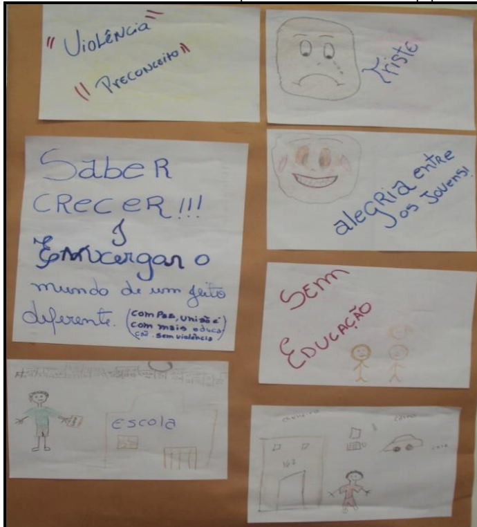
Fotografía 2. Cartel sobre el entendimiento de lo que es ser joven en la realidad brasileira elaborado por los adolescentes del equipo 2

El segundo equipo presentó el siguiente cartel (Fotografía 2):