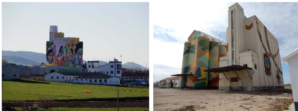
Figura 7 y 8. Silos de Calzada de Calatrava (izq.) y Manzanares I y II (dcha.).