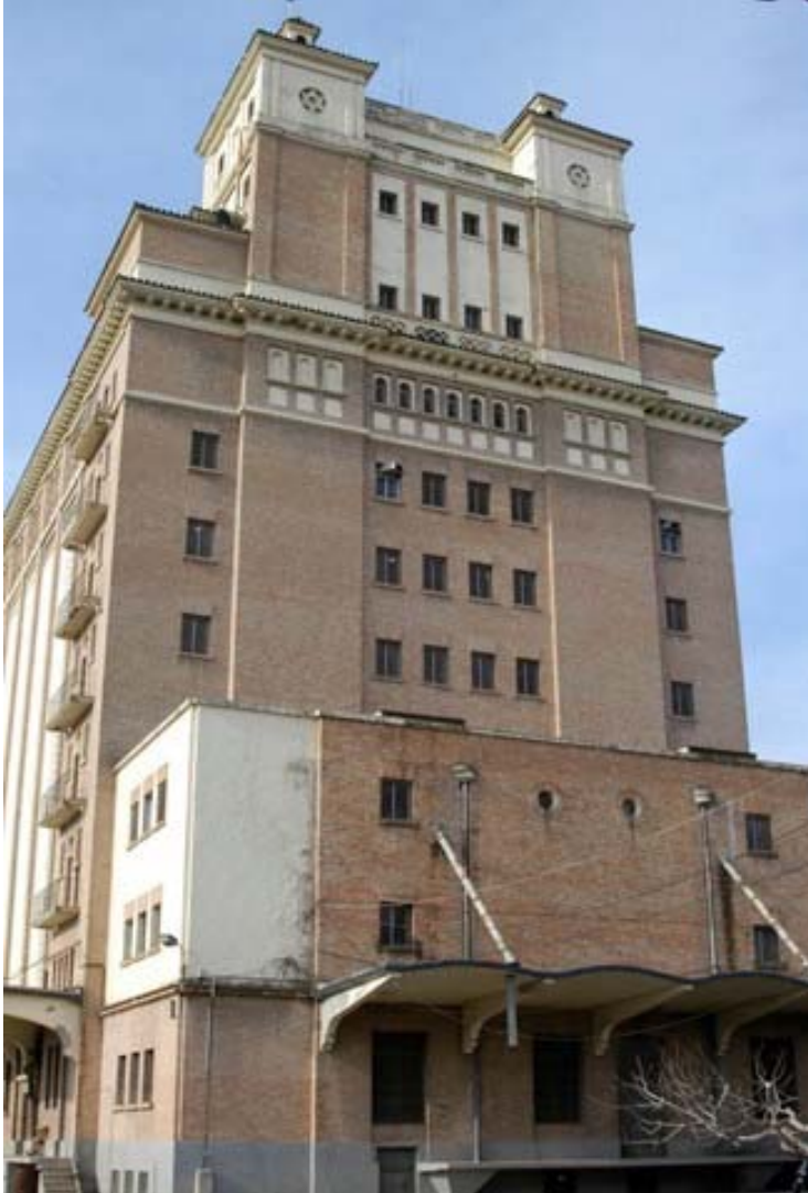
Figura 6. Silo de la Córdoba (Depósito del Museo Arqueológico Municipal).

gran proyecto urbanístico que incluía el trazado de la avenida Medina Azahara (Europa Press, 2015), contribuyendo a la revitalización de esta zona. Hoy, rehabilitado, “se mantiene en buen estado tanto la maquinaria como el edificio y, lejos del abandono, destrucción o expolio que han sufrido otros ejemplares, su uso como depósito del Museo Arqueológico lo ha dotado nuevamente de utilidad, compatible con la conservación del silo como excepcional ejemplo de arquitectura industrial” (Jordano, 2012: 278).