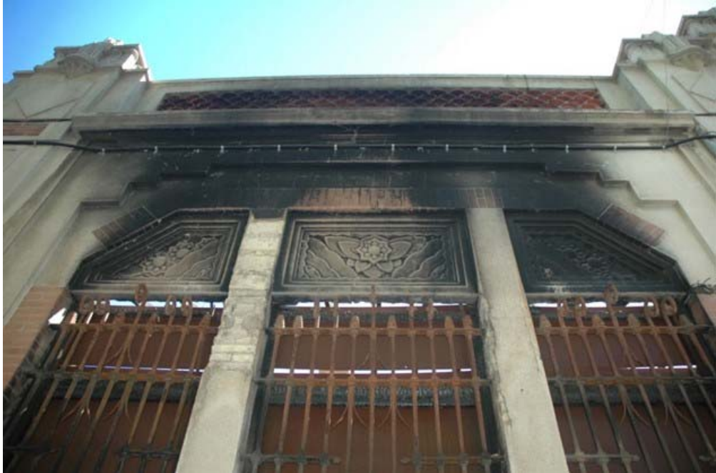
Figura 3. Detalle de fachada de Bombas hidráulicas Gens, S. L. tras el incendio de 2014.

el diseño del azulejo de los baños del complejo, y la apertura del refugio antiaéreo cuya estructura corresponde a la tipología de tipo fabril (Galdón, 2007).