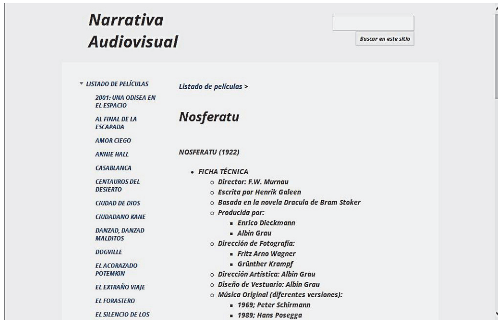
Fig. 1 Listado completo de las películas de visionado obligatorio. Ficha de “Nosferatu”

En este fragmento de la página web podemos observar el listado completo de las películas de visionado obligatorio a la izquierda. El alumno podía “pinchar” sobre el listado y aparecían los datos sobre la película. En el ejemplo se puede ver el inicio de la ficha técnica de la película Nosferatu.