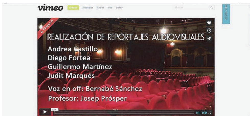
Fig. 2 Imagen de Vimeo: ilustración de las posibilidades para remitir archivos de video al profesor en privado. Caso de “Realización de reportajes audiovisuales”

Un ejemplo de lo que estamos comentando lo tenemos en la siguiente imagen: