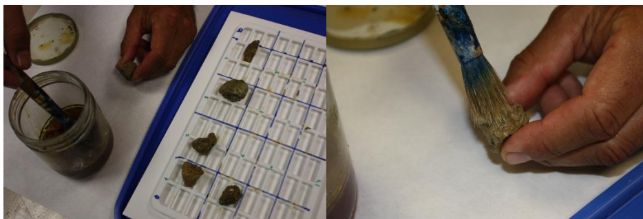
Figura 4:- Barnizado del agregado