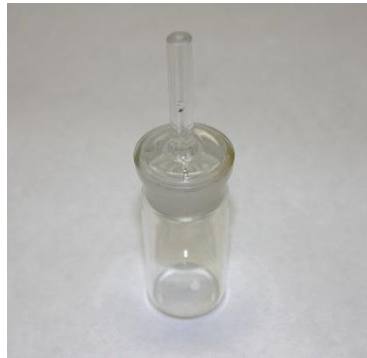
Figura 3:- Pícnómetro

Si lo llenamos de un fluido de densidad conocida, introducimos en él un cuerpo de masa igualmente conocida y luego tapamos el picnómetro, por el capilar se evacuará una cantidad de fluido exactamente igual al volumen del cuerpo introducido.