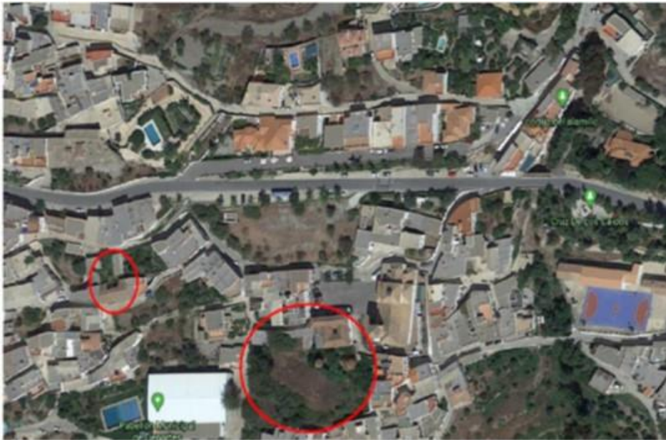
Fig. 8. Localización Casa de Aben Humeya (derecha) y la Casa de Isabelita (izquierda). Elaboración propia a partir de captura de imagen de google maps.