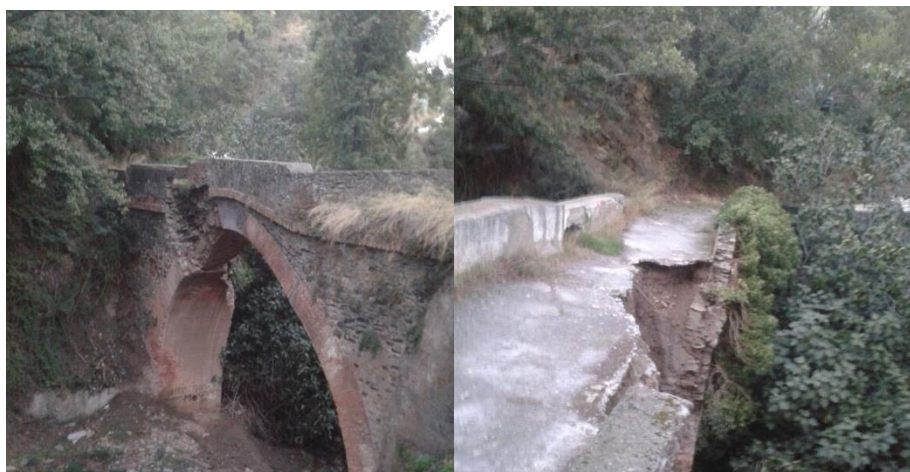
Fig. 4. Puente de la Tableta antes del inicio de las obras.

Por lo que respecta al Puente de la Tableta, es de titularidad municipal, como indica la ficha del catálogo del P.G.O.U. Se trata de una infraestructura datada en el siglo XIV con un arco apuntado y la cimbra en ladrillo, siendo su relleno en mampostería y lajas de pizarra. Se sitúa en el camino viejo entre Almería y Granada. Tras varias actuaciones desafortunadas, en el año 2014 se produce la restauración más preciada gracias a la corporación municipal y al movimiento vecinal que recogió firmas para una actuación urgente ante el peligro de derrumbe que presentaba. Además, el puente forma parte de la red de senderos del GR7, y es una de las principales vías de entrada a la vega del municipio.