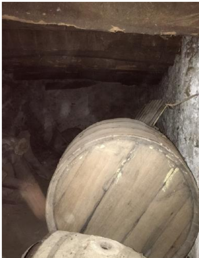
Fig. 13. Bodega de la Casa de Isabelita.

Tipológicamente responde a un tipo de arquitectura tradicional de La Alpujarra oriental relacionada con las clases más pudientes, que tras la rebelión morisca se ubicaron en torno a Ugíjar y las poblaciones cercanas, lo que dio pie a que durante la modernidad se convirtiera en el centro neurálgico de la región.