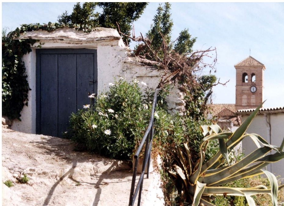
Fig. 7. Vista de la torre de la Iglesia de Válor. Mancomunidad de Municipios de La Alpujarra Granadina /Creados.

escuela de Alonso Cano y la imagen del Cristo de la Yedra, patrón de La Alpujarra.