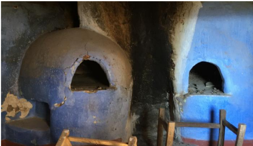
Fig. 12. Cocina de la Casa de Isabelita.