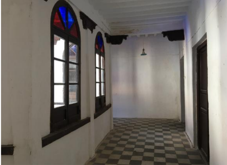
Fig. 11. Interior de la Casa de Isabelita.