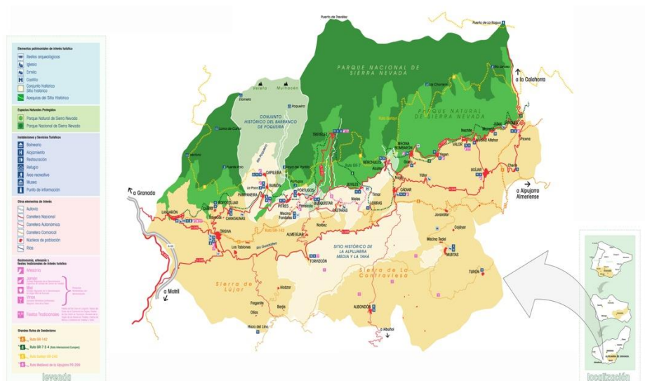
Fig. 1. Mapa de La Alpujarra granadina y su patrimonio.

patrimonio, como quedó demostrado en la resistencia al proyecto “La Alpujarra Patrimonio de la Humanidad”, o en el rechazo a diversas normativas del Parque Natural y Nacional de Sierra Nevada.