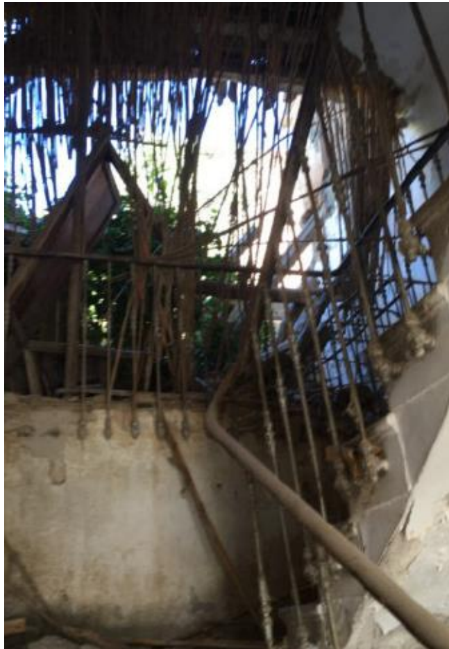
Fig. .15 Interior de la Casa de Aben-Humeya.

Atendiendo a su estructura, se ajusta a una manzana cerrada con patio trasero y dos construcciones adosadas que se utilizaban como almacén y cochera. Datada en el siglo XIX, la edificación cuenta con tres plantas en altura, habiendo tenido una última reconstrucción en 1952.