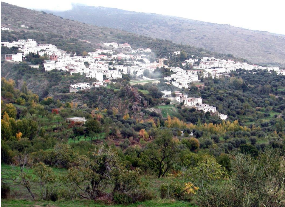
Fig. 2. Vista de Válor.

Junto a lo anterior, las iniciativas que se han llevado a cabo muestran, sin duda, que, a pesar de la dudosa eficacia de la gestión, existe una preocupación por encontrar soluciones que lleven a una buena conservación del patrimonio atesorado.