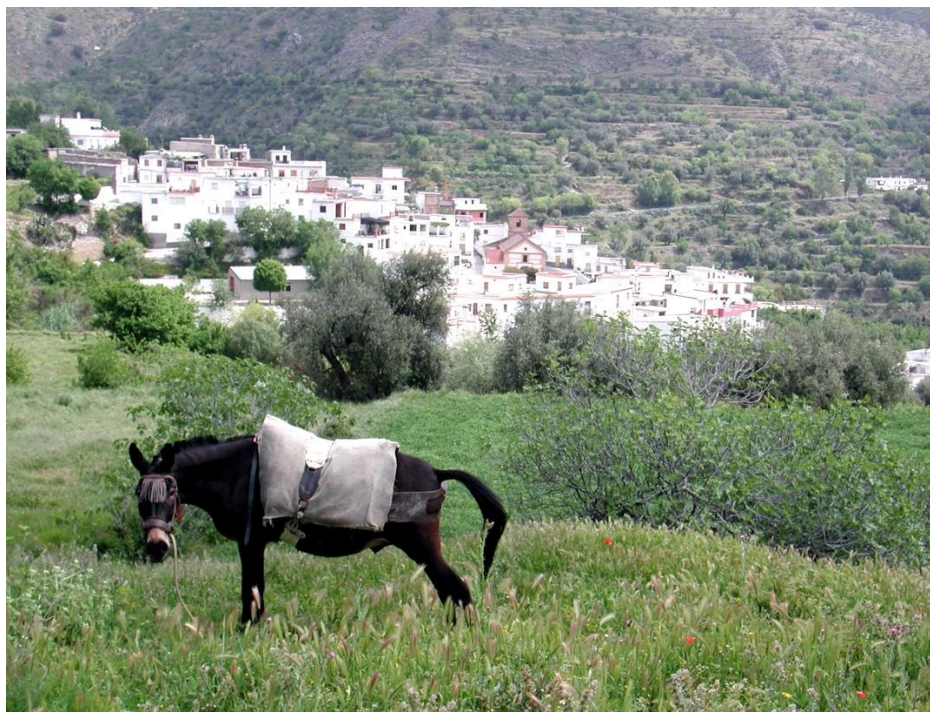
Fig. 3. Vista de Mecina Alfahar.

Desde el punto de vista de su población, la tendencia ha sido a la disminución. En 1960 registraba un censo de 2232 habitantes, que se ha reducido a 675 en la actualidad, lo que supone una disminución del 30,24%. Sus habitantes se distribuyen en los tres núcleos urbanos: 112 en Mecina Alfahar, 47 en Nechite y 516 en Válór. La progresiva despoblación de toda la comarca, sumada al envejecimiento (la edad de los habitantes de Válór es de 50,60 años), hace, si cabe, más dramática la situación (Ruiz et al., 2018). Esta circunstancia no ha pasado desapercibida y el Ayuntamiento ha mostrado gran preocupación uniéndose a los grupos de trabajo sobre despoblamiento y participando en acciones como la visita al Parlamento Europeo en 2018 para negociar el cambio de criterios de las ayudas europeas. A ello se une el problema del desempleo, registrando 55 personas en paro en febrero de 2020.