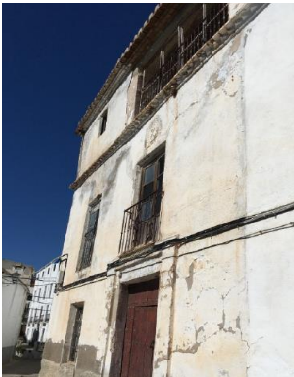
Fig. 14. Fachada principal de la Casa de Aben Humeya.

La edificación denominada “Casa de Aben Humeya” se sitúa en el antiguo Barrio Carnicería (actual calle de Aben Humeya, número 8), junto al edificio del Ayuntamiento Viejo. El edificio está incluido en el catálogo de bienes inmuebles de las normas de planeamiento de Válor en la ficha nº 5.