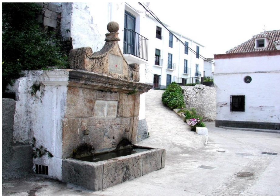
Fig. 6. Fuente de la Plaza. Mancomunidad de Municipios de la Alpujarra Granadina /Creados.

y rematado con una bola en su vértice. Adosada a un talud natural, aún sigue surtiendo de agua, siendo su estado de conservación bueno. Constituye sin duda, un elemento identitario del municipio de Válor.