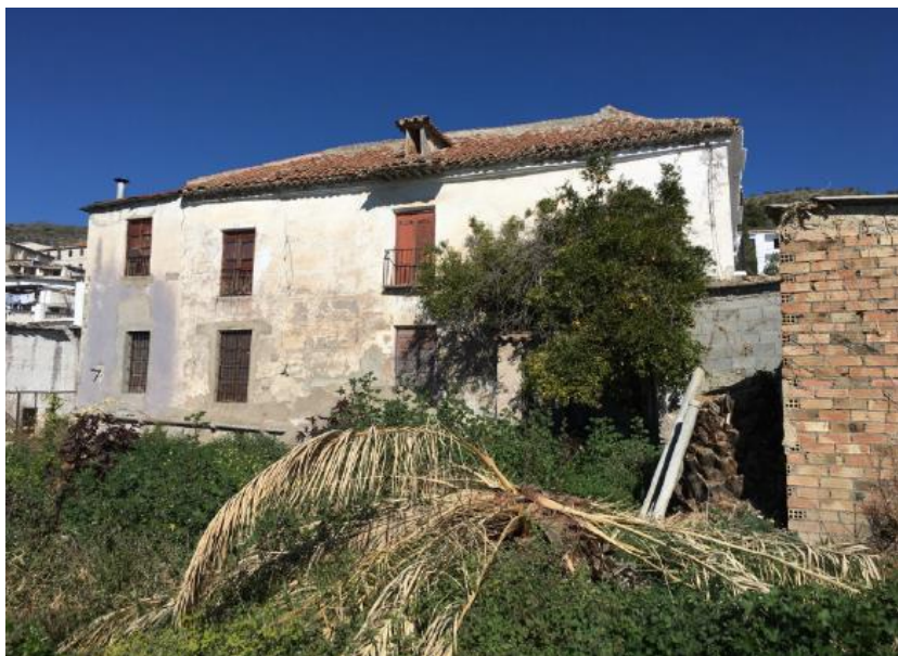
Fig. 10. Jardín de la Casa de Isabelita.

Destaca asimismo el amplio jardín con el que cuenta la vivienda, segregado de la finca matriz y que actualmente se encuentra sin cultivar y dispone de dos pequeñas construcciones destinadas a aparcamiento y almacén.