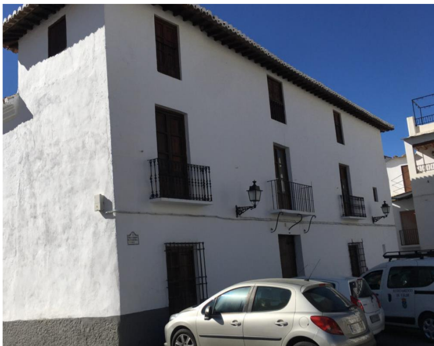
Fig. 9. Casa de Isabelita.

Destaca asimismo el amplio jardín con el que cuenta la vivienda, segregado de la finca matriz y que actualmente se encuentra sin cultivar y dispone de dos pequeñas construcciones destinadas a aparcamiento y almacén.