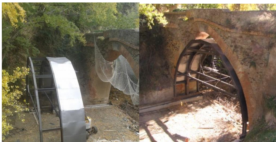
Fig. 5. Restauración del Puente de la Tableta. Fuente: Ayuntamiento de Válor.