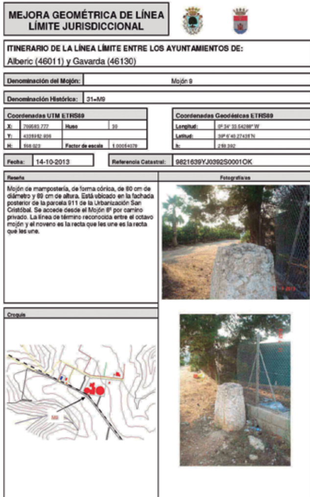
Figura 3. Imagen reseña mojón 9º (M9).

De esta manera, surgen dos representaciones de un mismo hecho, con una variación temporal de aproximadamente 30 años, pero con propósito diferente y a escalas de representación muy distintas [5]. Por una parte, la administrativa, en la cual se sustenta la actual definición de municipios, de provincias y el estado y, por otra parte, la fiscal que trata de determinar la riqueza del territorio. La correcta delimitación de dicha línea sería interesante que finalmente fuera también plasmada en la cartografía catastral.