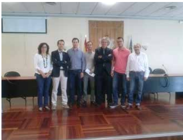
Figura 5. Acto de la firma del acta adicional (alcaldes, IGN y profesional liberal, 2014).

Tras el reconocimiento de los mojones existentes en la actualidad se procedió a la mejora geométrica de estos, mediante la observación con instrumentación topográfica GNSS [6], y la recuperación de los destruidos. Para ello se partió de las coordenadas topográficas observadas de los mojones 3 y 4, así como de las observaciones relativas a los mojones destruidos, incluido el auxiliar del mojón de tres términos (figura 4).