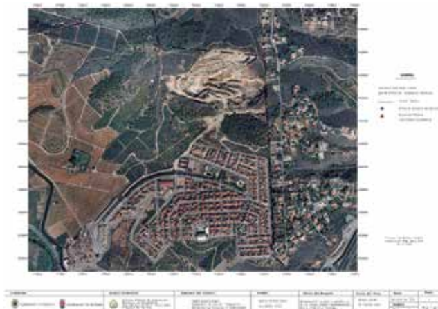
Figura 4. Plano con distribución de los mojones M2, M3 y M4 a lo largo de la línea límite jurisdiccional, sobre ortofoto PNOA.

La línea límite común a Alberic y Gavarda tiene el mojón inicial, de tres términos, en el eje geométrico del Río Júcar, correspondiente al año 1903. Este mojón, es común al municipio de Villanueva de Castellón. Debido a la imposibilidad de su materialización, tiene un mojón auxiliar el cual fue destruido por la construcción de la Autovía A7, así como el mojón segundo el cual ubica en el centro de la antigua batería de defensa de origen morisco que durante el proceso de restauración fue destruido el mojón. El resto de los mojones, hasta el décimo que es común al municipio de Antella, se observaron en buen estado de conservación.