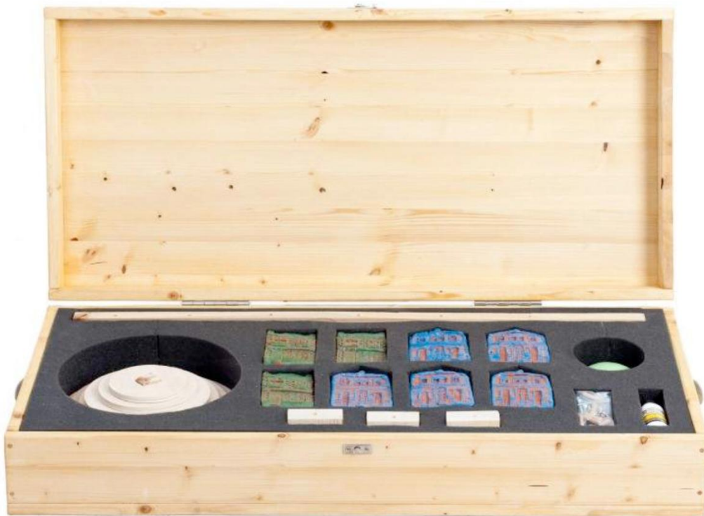
Figura 3. Caja con las piezas para montar la escultura “Cabanyal 1641” Construye tu propio edificio puntero con un barrio histórico!

De manera simbólica construimos una escultura con las casas expropiadas presentadas en cubos de cerámica en dos colores. Representaba la forma tradicional de las casas en este barrio. La idea residía en la proclama Construye tu propio edificio puntero con un barrio histórico! en referencia al plan de derribo de este barrio vigente en el momento para ser reconstruido en una forma de arquitectura in vitro . Para ello nos basamos en el edificio 30st Mary Axe de Londres del arquitecto Norman Foster. Planteamos un juego con estas instrucciones de montaje para darle un nuevo enfoque y visibilizar y hacer reflexionar sobre esta problemática. Reconstruir cada vez una escultura por parte del espectador o espectadora donde conformaríamos un edificio característico de estos centros neoliberales hecho con casas de un barrio popular tradicional.