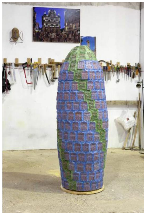
Figura 1. Escultura terminada en el taller.

De aquí surge el trabajo “Cabanyal 1641” que presenta una recolección de las casas que iban a ser expropiadas y derruidas en el Cabanyal, y ha supuesto una de las luchas vecinales más fervientes que se han vivido en la ciudad de València desde hace casi dos décadas. En la actualidad continua vigente aunque se haya paralizado este proceso de expropiación y derrumbe y se haya sustituido por otras dinámicas vinculadas a la gentrificación y el neoliberalismo. El número que se referencia en el trabajo se debe a las 1641 viviendas que iban a ser expropiadas a sabiendas de que sólo 1 de cada 3 familias iban a ser reubicadas en pisos de nueva construcción. El barrio sufrió un proceso de degradación concedido por las administraciones locales que es típico de estos procesos en cualquier ciudad del mundo.