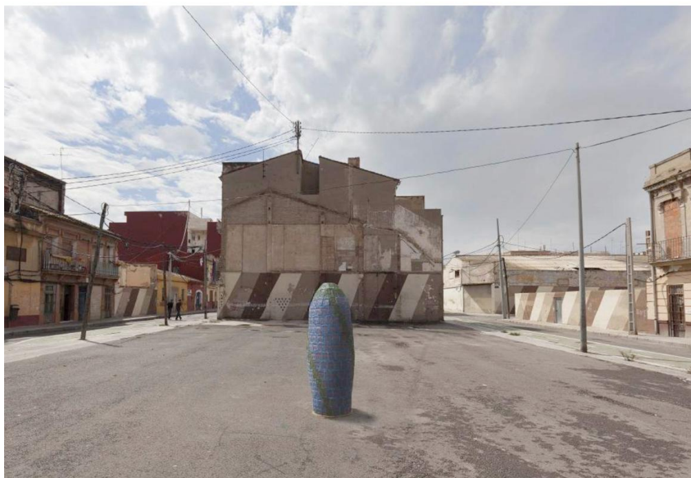
Figuras 4 y 5. Intervención pública de la escultura en el Cabanyal (València).