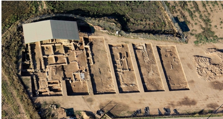
Figura 5. Vista aérea del yacimiento de Los Torrejones.