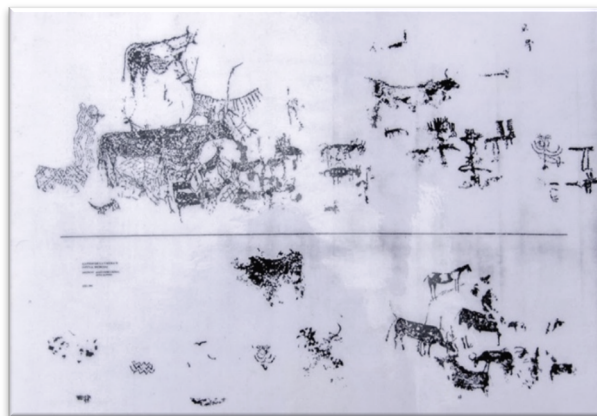
Figura 1. Calco de las pinturas de Cantos de Visera II.

El arte rupestre hace referencia a las pinturas o grabados, en lugares sangrados, que expresan situaciones que pudieron ser trascendentales para las sociedades de la época, mostrando una estructura ideológica, y cuya manera de interpretarlo se desconoce, lo que obliga a permanecer en un nivel contemplativo. Mauro Hernández, catedrático de la Universidad de Alicante y director del museo de esta, propuso cinco estilos pictóricos reconocidos en el arte rupestre levantino (Puche, Ruiz, 2019).