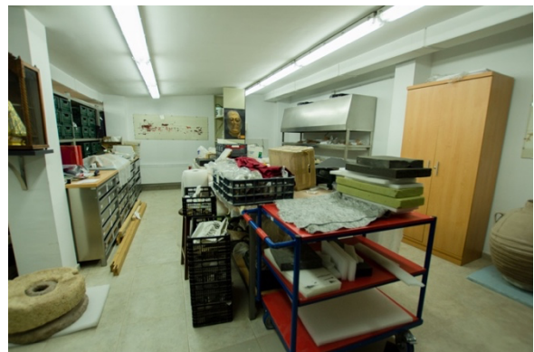
Figura 6. Laboratorio MAYE. Fuente propia.