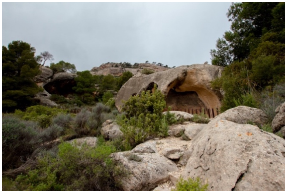
Figura 2. Monte Arabí.