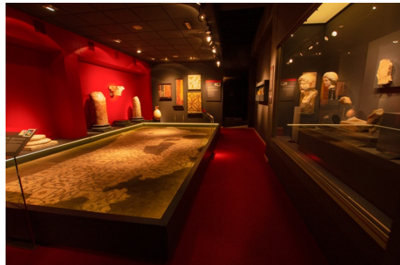
Figura 7. Museo Arqueológico Municipal.