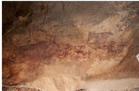
Figura 3. Pinturas rupestres Cantos de Visera II.