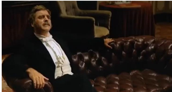
Figura 11. Don Fabrizio se fija en un cuadro de la biblioteca.

Uno de los momentos más emblemáticos de El gatopardo ocurre durante el gran baile en el palacio de los Ponteleone, cuando Don Fabrizio cavila sobre la muerte y la suya propia. La escena ocurre cuando Don Fabricio, aburrido, se dirige a la biblioteca. Allí no hay nadie más, está solo. Se toma una copa, se sienta en un sillón y contempla un cuadro conocido como Muerte del justo , de Jean – Baptiste Greuze.