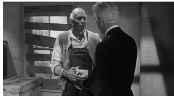
Figuras 7 y 8. Mismo plano. Ransom entra en la sala (Figura 7) y se despide de Pompey (Figura 8).

En el mismo plano se dirige hacia Pompey para darle algo de dinero y decirle que estarán en contacto con él. El plano se corta y le sucede otro en el que (arranca la música) Ransom sale de la sala y, mientras cierra la puerta mira unos segundos el ataúd y la cámara avanza acercándose al cactus. A continuación, se produce un fundido que nos lleva al interior del ferrocarril, donde vemos a Halle secándose las lágrimas y a Ransom con la mirada perdida.