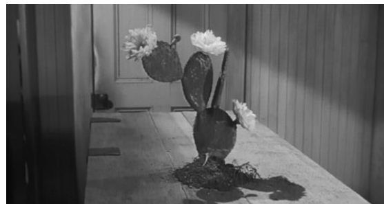
Figuras 9 y 10. Mismo plano. Ransom echa un último vistazo a Tom (Figura 9) y la cámara se acerca al cactus en flor mientras cierra la puerta (Figura 10).