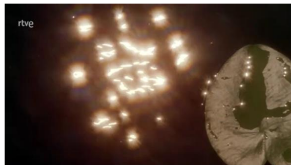
Figuras 18 y 19. Plano general de Golden Pond (Figura 18) y una hoja flotando en el agua con el sol reflejándose.