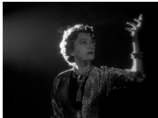
Figuras 3 y 4. Fragmento de Queen Kelly mostrado en el proyector (Figura 3) y Norma jurando un regreso triunfal (Figura4).