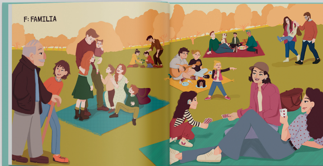
Fig. 5. Simulación de impresión nº2 (43 x 35cm)