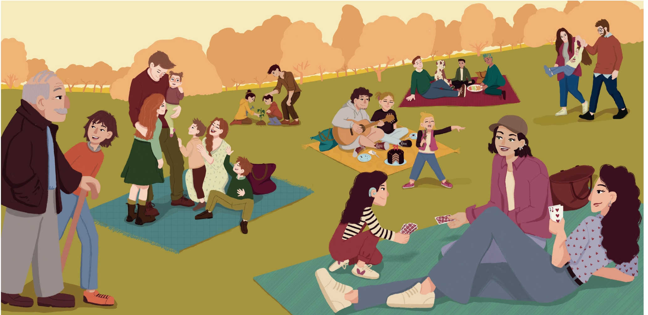
Fig. 2. Páginas finales del capítulo F (43 x 35cm)