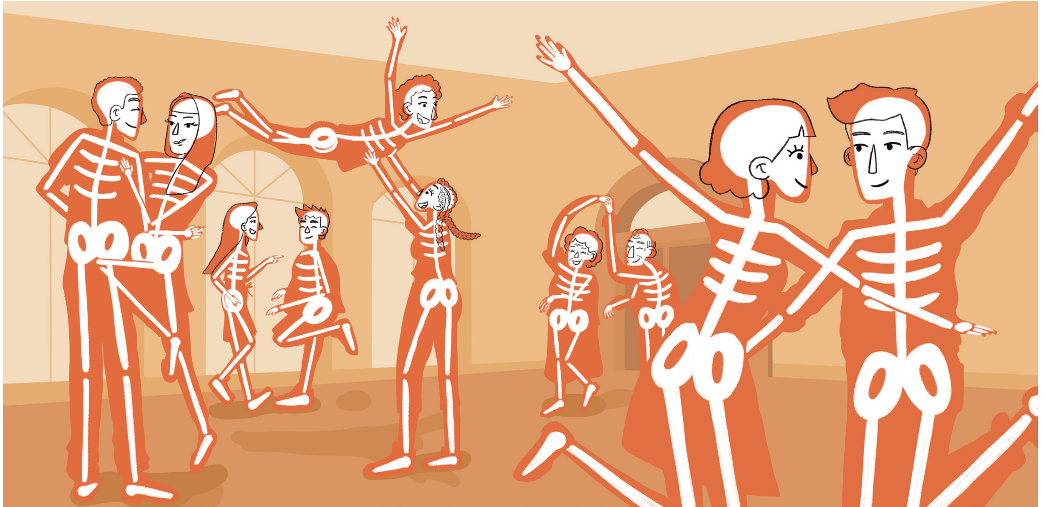
Fig. 1. Páginas finales del capítulo E (43 x 35cm)