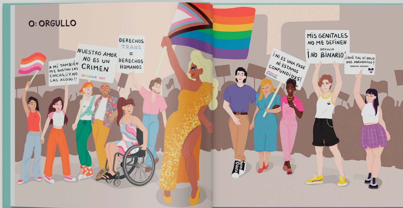
Fig. 6. Simulación de impresión nº3 (43 x 35cm)