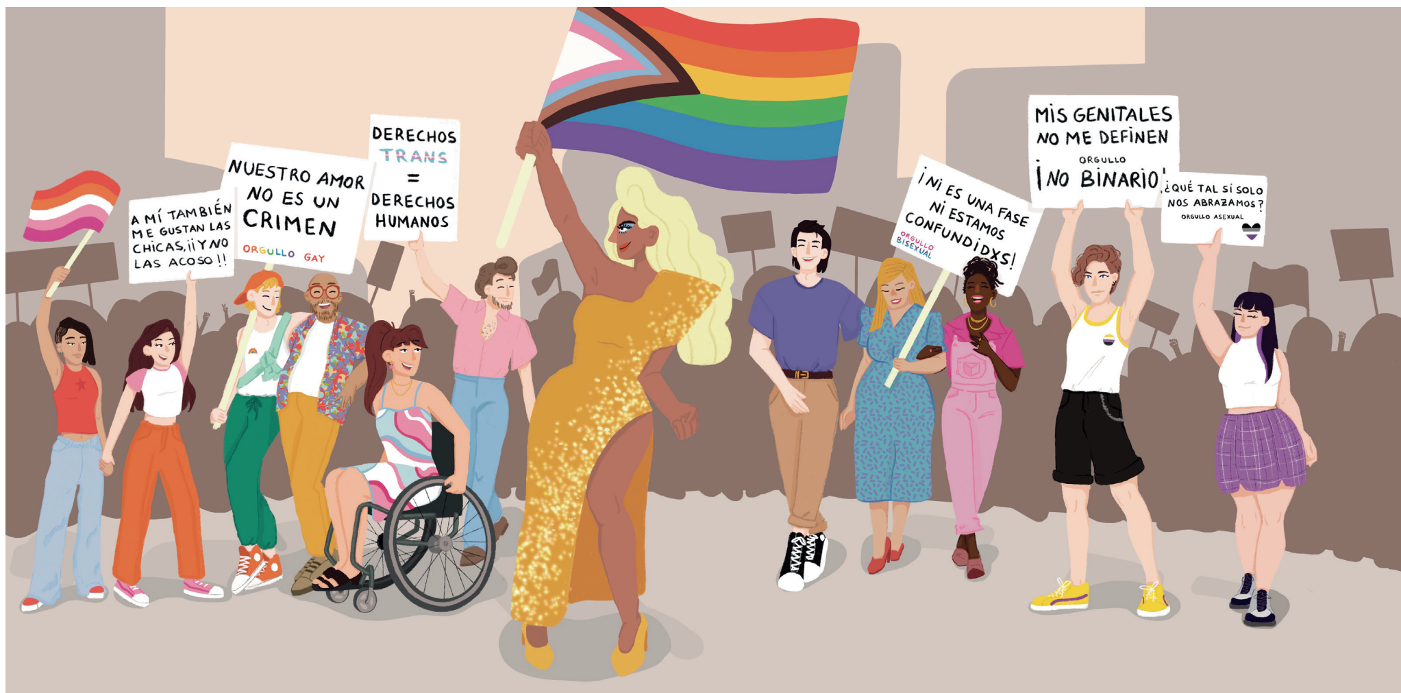
Fig. 3. Páginas finales del capítulo O (43 x 35cm)