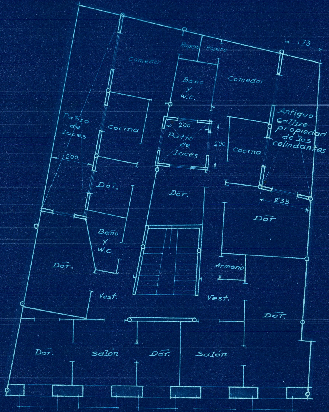
Planta común a pisos