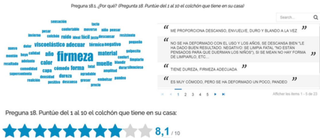
Figura 2. Nube de palabras y verbatim asociados a la valoración del colchón de los participantes

Las marcas de colchones sobre los que descansan habitualmente los sujetos de la muestra son variadas y, en general, valoraron muy positivamente el colchón que tienen en su casa (8.1 sobre 10). En la figura 2 se muestran algunos de los verbatim de los participantes relacionados con la valoración de su colchón, así como la nube de palabras asociada, obtenida mediante procesamiento de lenguaje natural. Las valoraciones positivas que los usuarios realizaron sobre sus colchones (en este caso productos de la competencia) indican que el sector de los sistemas de descanso es un sector maduro, en el que se debe buscar la diferenciación e incorporar nuevos atributos innovadores como aporte de valor.