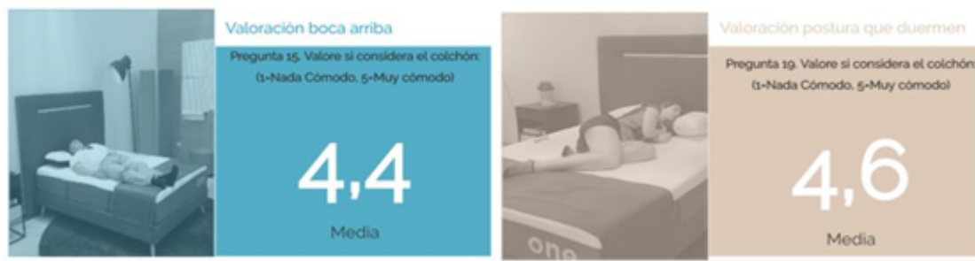
Figura 3. Momento y valoraciones de la exploración libre y guiada.

Aspectos como la firmeza, la ausencia de molestias, la adaptabilidad o el confort térmico percibido al acostarse han sido identificados como elementos clave a la hora de tomar la decisión final. En torno al 70% de los usuarios compraría el colchón ONE en caso de necesitar renovar su colchón. Asimismo, la mayoría de usuarios (83%) recomendaría el colchón a familiares y amigos. Destaca el confort como aspecto muy apreciado del colchón, con puntuaciones de 4.4 y 4.6 sobre 5, tras la valoración realizada boca arriba y la postura habitual en la que duermen los usuarios, respectivamente.