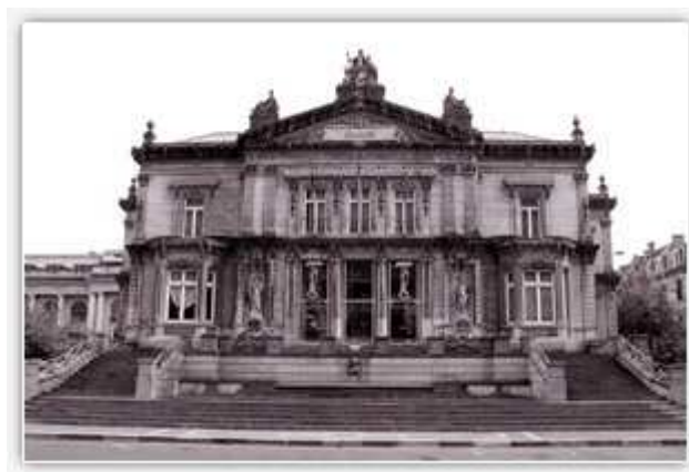
Antiguo balneario de Spa