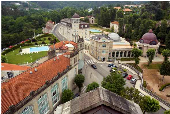
Balneario de Mondariz

El balneario consta con programas con alojamiento incluido en el hotel. Posee programas de relajación, belleza o premamá entre otros, sin olvidar la importancia del circuito Celta, con el que pretenden trasladar a los clientes a la antigua Galicia.