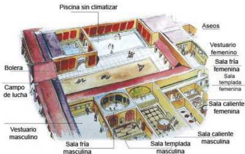
Ejemplo de terma romana.