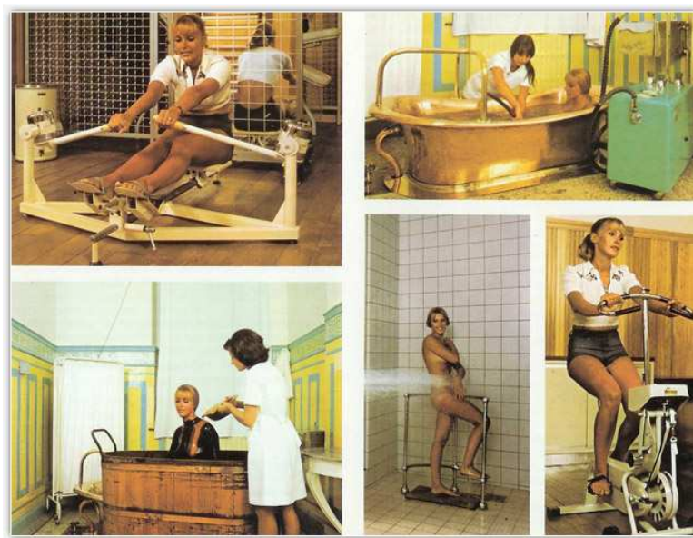
Thermes de Spa, años 80

La historia de este establecimiento está totalmente ligada a la historia de su ciudad, la hidroterapia y su propio desarrollo. Éste establecimiento fue construido en 1868 con 54 tinas de baños. El agua que se utilizaba provenía directamente del manantial Clementine cuyas aguas están compuestas por minerales naturales beneficiosos para la piel.