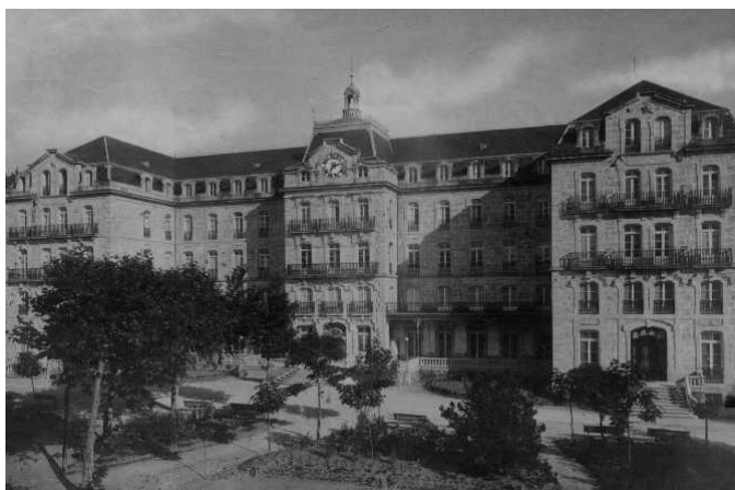
Gran Hotel en el año 1898

Siguiendo con la historia del complejo de Mondariz, la web del mismo balneario, cuenta que en 1898 se inauguró el Gran Hotel, el cual se construyó sobre los planos del arquitecto Genaro de la Fuente, a raíz de la gran cantidad de visitantes que recibía Mondariz. El hotel resultó ser uno de los más lujosos de la época, entre otras cosas porque creó un programa de ópera.