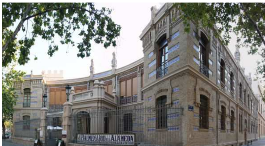
Balneario de la Alameda, año 2012