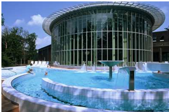
Les Thermes de Spa actualmente