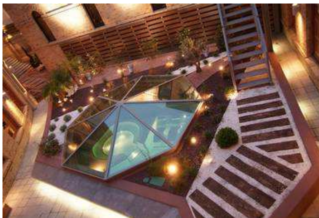
Vista de la claraboya desde arriba