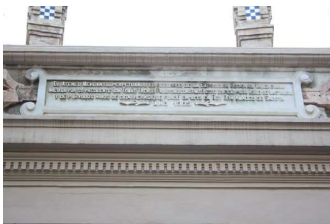
Lápida del pórtico, año 2012