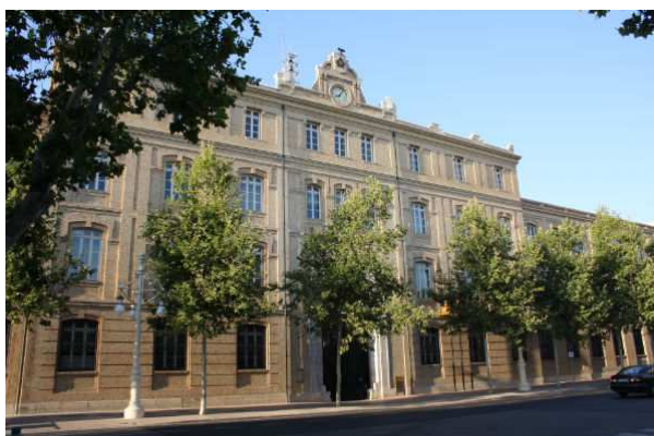
Tabacalera de Valencia. Año 2012

cigarreras que trabajaban en la Tabacalera. Se trataba de una guardería infantil a cargo de las hermanas de la caridad.