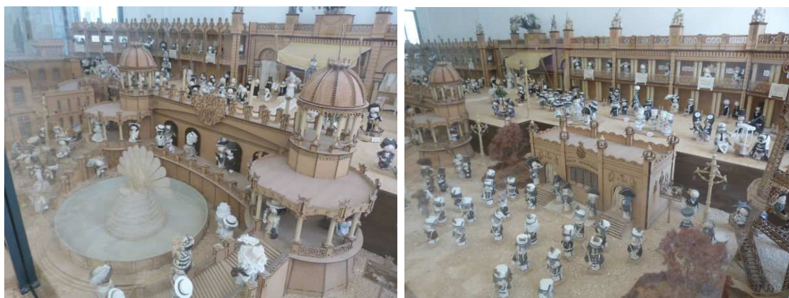
Imágenes de la maqueta de la Exposición Regional

La Exposición Regional Valenciana en 1909 marcó sin dudar uno de los hechos más importantes en la historia de Valencia. La Exposición contaba con un espacio de 16,4 hectáreas, en las cuales habían diversos edificios para el evento como: el Auditorio, el Casino, el Teatro, circo, etc. La Exposición Regional sirvió para mostrar a las demás ciudades la cultura, la industria y la sociedad valenciana, como bien explica Ballester-Olmos (2007).