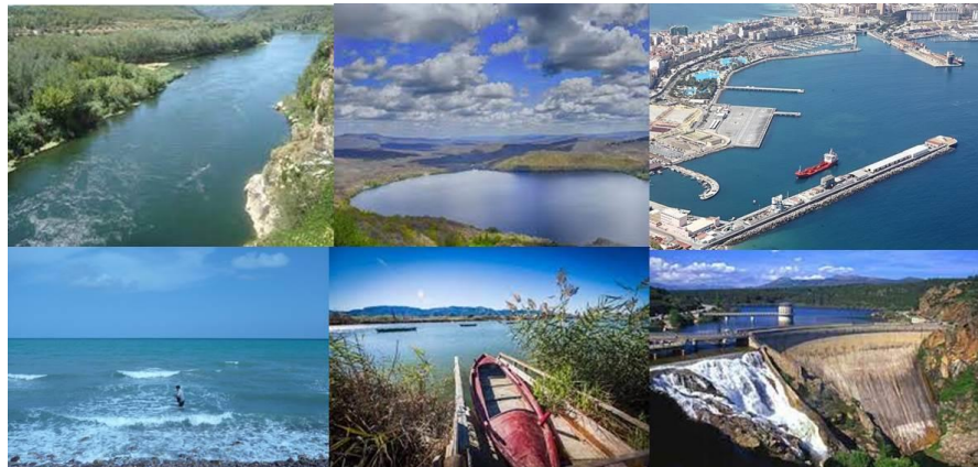
Imagen 3: Diferentes tipos de masas de agua superficial