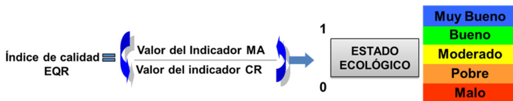
Imagen 1: Índice de Calidad Ambiental y clasificación de Estado Ecológico

Por otra parte, el estado ecológico es una expresión de la calidad de la estructura y el funcionamiento de los ecosistemas acuáticos asociados a las aguas superficiales en relación con las condiciones de referencia. Por primera vez se tiene en cuenta la estructura de los ecosistemas acuáticos, y no solo los parámetros fisicoquímicos que los definen. Además, se establece la necesidad de definir unas condiciones de referencia que corresponden al estado en que se encuentran los distintos elementos de calidad en aquellas masas de agua que existen en estado prístino, con prácticamente ninguna o muy pocas alteraciones derivadas de las actividades humanas. Estas condiciones de referencia son el objetivo a alcanzar. La relación entre los valores de los parámetros observados para una masa de agua determinada y los valores establecidos como condiciones de referencia se expresa numéricamente mediante ratios comprendidos entre 0 (mal estado) y 1 (muy buen estado) que se denominan Índices de Calidad Ambiental (EQR: Environmental Quality Ratio ).