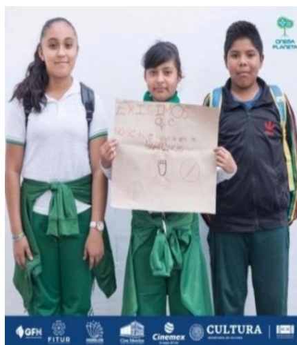
Foto 3. ¡No más basuras en nuestras barrancas! El día de hoy marchamos por nuestro futuro, #fridaysforfuture es un evento a nivel internacional donde se protesta por el cambio climático. Pequeñas acciones, grandes cambios. Tomado de Instagram (24 de mayo de 2019)

Es una alerta que exige a las personas ante el señalamiento de dos (2) signos principales. El primero indica no botar basura, y el segundo nos muestra la huella que dejan las acciones: el impacto ambiental negativo sobre el ambiente. Específicamente, el hombre con sus actividades contaminantes cada día, afecta a todos, incluso a la generación del presente (niños y niñas) y la generación del futuro (sus hijos), ver Foto 3: