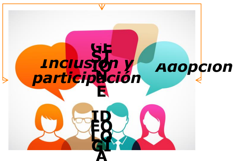
Figura 1. Subcategorías de gestión e ideología. Construida por la investigadora 2021.

Este último plano fue develado por las voces de los directores de festivales mediante dos subcategorías: La adopción, la participación e inclusión (Ver Figura 1). Elementos de importancia que se apoyan de los planos antes mencionados (comunicativo, reorganizativo y valores).