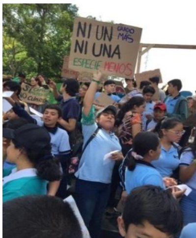
Foto 2. Movimiento por el clima #fridaysforfuture.

Es una alerta que exige a las personas ante el señalamiento de dos (2) signos principales. El primero indica no botar basura, y el segundo nos muestra la huella que dejan las acciones: el impacto ambiental negativo sobre el ambiente. Específicamente, el hombre con sus actividades contaminantes cada día, afecta a todos, incluso a la generación del presente (niños y niñas) y la generación del futuro (sus hijos), ver Foto 3: