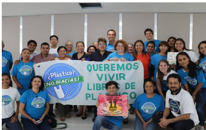
Foto 1. Se aprueba la Ley de Residuos Sólidos en Morelos que prohíben el uso de plásticos de un solo uso !Viva Morelos!.

El segundo caso aplica más directamente al apoyo que brinda el director (directora) de festivales a las ONG's que luchan por la aprobación de leyes. Un ejemplo, es la prohibición de plásticos de un solo uso en Morelos (Ver Foto 1):