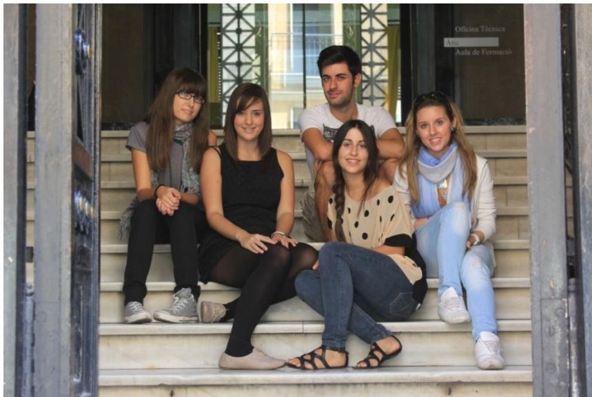
El equipo técnico al finalizar el rodaje

Finalmente una vez ya inmersos en el rodaje y tras ver las posibilidades que el escenario nos ofrecía (y con la ayuda del personal técnico) decido hacer un leve cambio en el final. Este cambio solo afectaba a la forma en que los dos personajes se reencontraban.