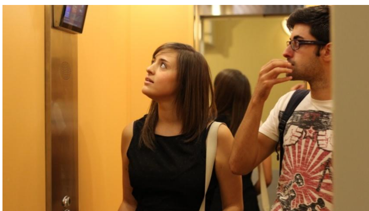
Los actores en el último plano

Además, los actores habían ensayado su papel, y la persona que trabajaba como script iba leyendo sus diálogos para que tuvieran en cuenta en qué momento debían hacer determinados gestos o levantarse.