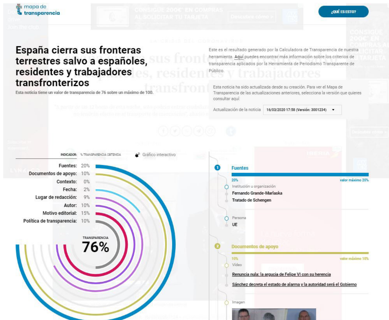
Figura 2. Mapa de transparencia de una noticia.

diversos parámetros que se muestran en la tabla 1: