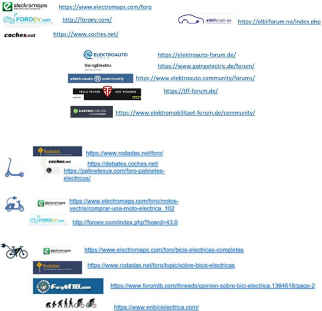
Figura 2: Foros visitados al realizar las observaciones.

Para realizar las observaciones hemos empleado una metodología online denominada Netnografía . Éste es un método de observación orientado a comprender la interacción social en contextos actuales de comunicación digital, tales como redes sociales y foros temáticos. De este modo, se emplean como datos las conversaciones libres que ocurren en estas plataformas.