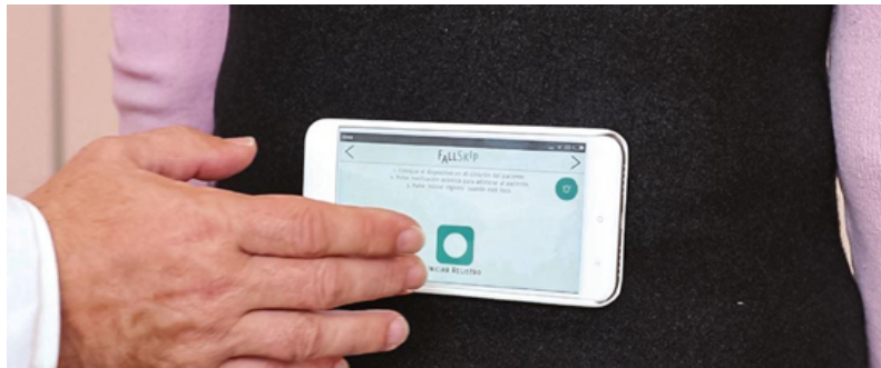
Figura 1. Colocación de Fallskip en la región lumbar.

FallSkip se compone de una técnica de registro encapsulada en un dispositivo tipo Android y un protocolo de medida especialmente diseñado para la valoración del riesgo de caída. El protocolo, basado en el test Timed up and go (Shumway-Cook et al. , 2000) modificado, incluye cuatro fases consecutivas: bipedestación, inicio de la marcha tras un estímulo sonoro, sentarse y levantarse de una silla y, por último, marcha de nuevo. El dispositivo se coloca de forma sencilla en la región lumbar del sujeto evaluado (Figura 1) y mide las aceleraciones del centro de gravedad durante la prueba, lo que permite a su vez obtener parámetros biomecánicos relacionados con el equilibrio, la marcha, la actividad de sentarse y levantarse, y el tiempo de reacción.