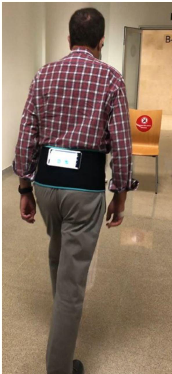
Figura 3. Momento de la valoración con Fallskip en paciente con secuelas tras Covid-19.

El estudio de pacientes con secuelas Covid-19 sigue vigente, y aún son muchas las incógnitas en relación a los efectos de esta enfermedad a largo plazo. No obstante, algunos de los hallazgos encontrados ya han sido expuestos en diversos foros. En el caso del Hospital General de Valencia, los resultados de la valoración al mes del alta en la Unidad de Cuidados Intensivos indican que entre las secuelas más frecuentes se encuentran la disnea, artromialgias, ansiedad/depresión, deterioro del equilibrio con aumento del riesgo de caídas y pérdida de fuerza de empuñamiento en ambas manos. (Ezzeddine, A. et al. , 2021). Por su parte, los resultados preliminares del estudio puesto en marcha en el Hospital La Fe de Valencia muestran una recuperación funcional significativa entre los 4 y los 6 meses tras el alta, destacando la mejora en los parámetros relacionados con fuerza en miembros inferiores y su correlación con la puntuación en el apartado “Sit to Stand” de FallSkip, así como en el apartado de equilibrio y en el índice final de riesgo de caída (D’Ors, C. et al. , 2021).