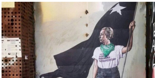
Figura 10. Fotografía del mural de Gabriela Mistral en el Centro Cultural GAM en Santiago de Chile.