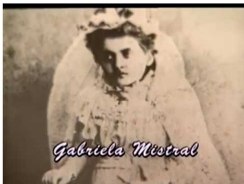
Figura 1. Captura de documental de “Historias de Vida