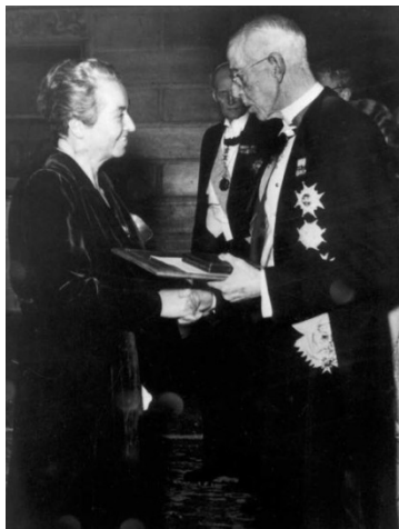
Figura 4. Entrega Premio Nobel de Literatura, en el sitio de la Universidad de Chile.