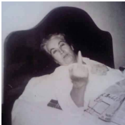
Figura 8. Fotografía de Gabriela Mistral.