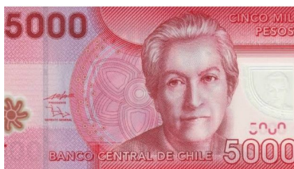
Figura 7. Imagen de billete chileno de cinco mil pesos.