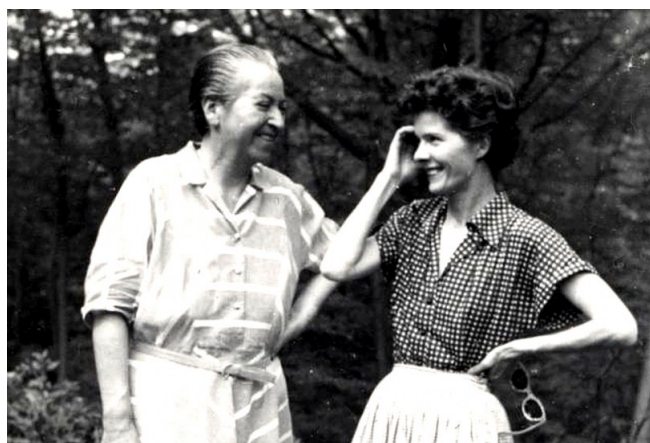
Figura 6. Fotografía de Gabriela Mistral y Doris Dana publicada en el periódico digital “El Desconcierto”.