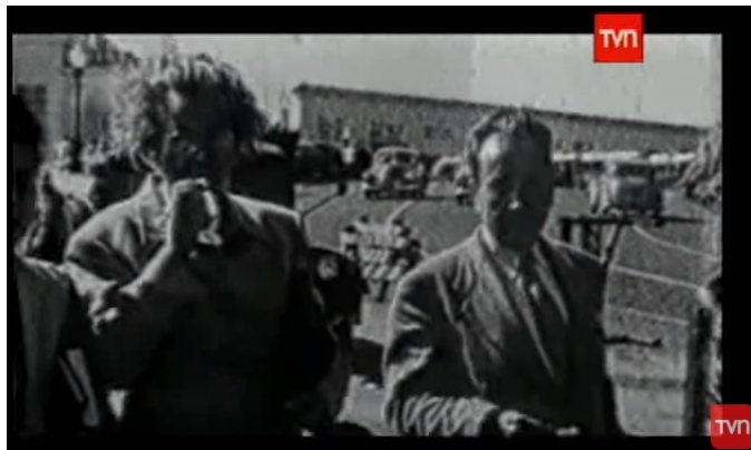
Figura 5. Captura de pantalla del documental “Grandes Chilenos”, emitido por Televisión Nacional de Chile.