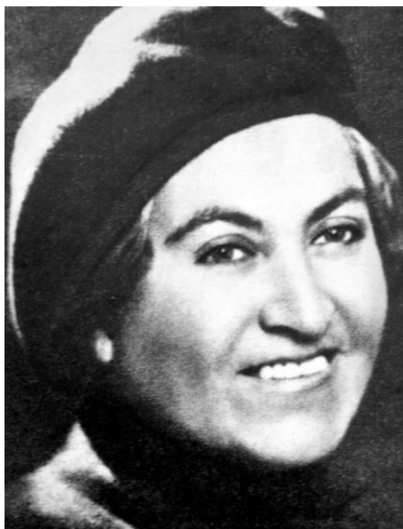
Figura 2. Fotograf3a de Gabriela Mistral en sitio de la Universidad de Chile.