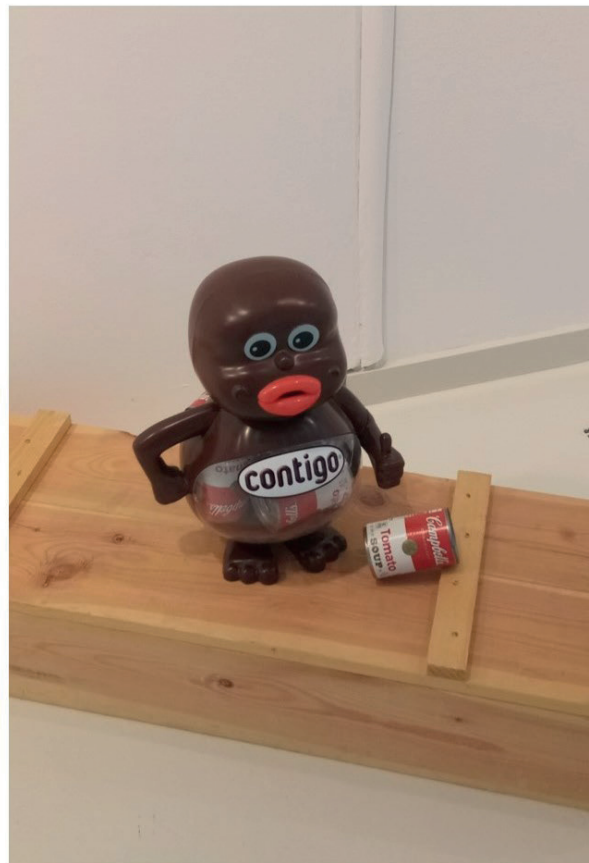
Fig. 2. A) Alejandro Gorafe, Amortérate . B) Enhorabuena (Manuel Pérez Valero).