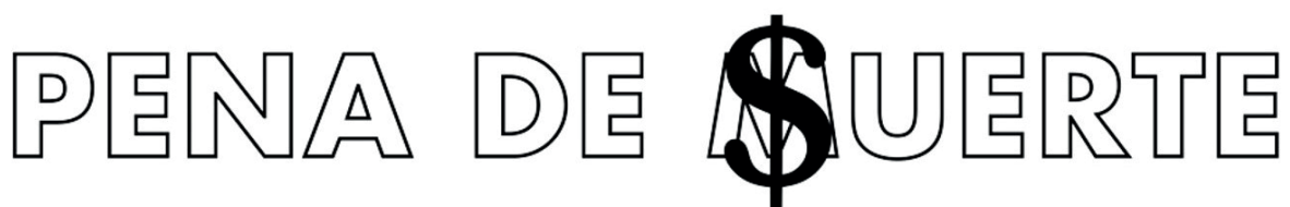
Fig. 1. Antonio Gómez, Pena de Suerte .

En las obras seleccionadas, los juegos de palabras son la base de composiciones gráficas que las dotan de una expresión formal, o bien acompañan objetos o esculturas, completando la obra, a veces sólo a