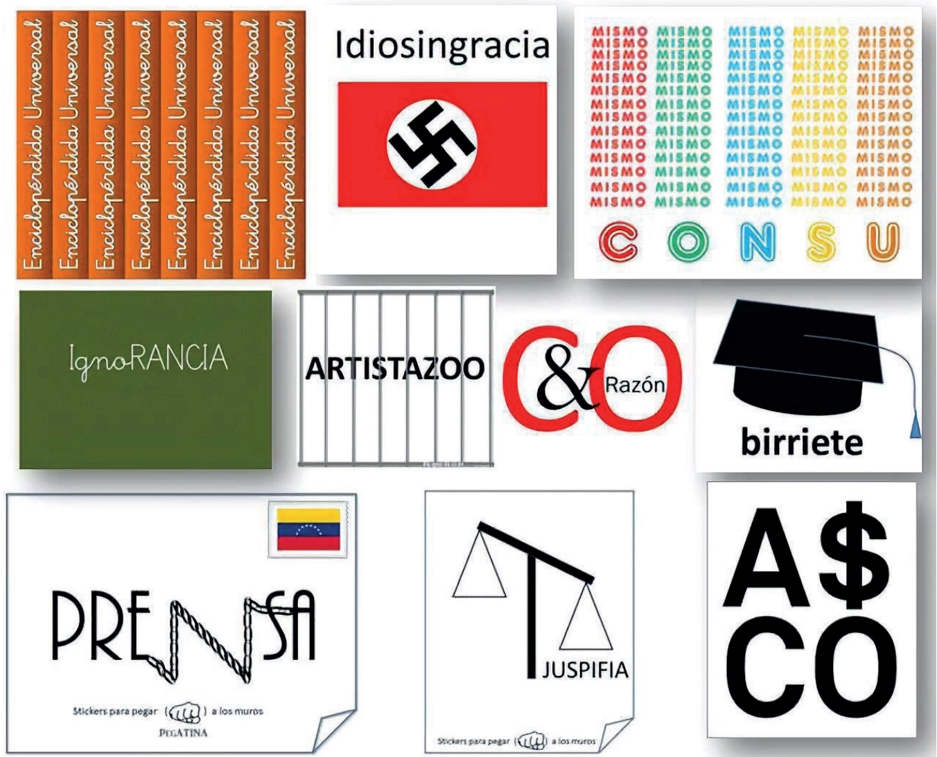
Fig. 6. Serie “Esta vida es un bidón”. Autoría propia

Las obras de Julián Alonso, que presentan la elipsis de un lexema: la «t» caída de rutina/ruina (Fig. 5B), o la «i» apenas visible de ilusión/iluso (Fig. 5G). Mientras que en la propuesta de Javier Jaén (Fig. 5L), se nos muestra el icono de like de las redes sociales, donde la «i» ha desaparecido, siendo el lector-espectador quien reconstruya y caiga en el error-trampa. En la obra de Felipe Zapico Alonso (Fig. 5I) podemos leer «3% a ras de sueño», identificando la «ñ» impostora que suplanta la palabra original.