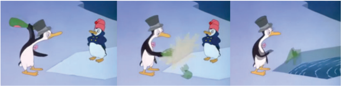
Ilustración 3. Disney (1944). Contaminación de los océanos en el corto “El pingüino de sangre fría” [Figura]. En Los tres caballeros (Disney, 1944)