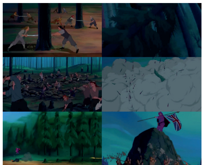
Ilustración 7. Pentecost (1995). Superioridad sesgada de la humanidad con respecto a la naturaleza [Figura]. En Pocahontas (Pentecost, 1995)

Studio Ghibli se funda con Hayao Miyazaki en 1985 (Hernández, 2013); convirtiéndose en una gran potencia oriental y global (Martínez, 2015). Dicha influencia se explica por la atribución de humanismo (Robles, 2013) a quienes las protagonizan y a las historias que se transmiten. De hecho, las producciones de Studio Ghibli se muestran como una alternativa para la educación del colectivo in-