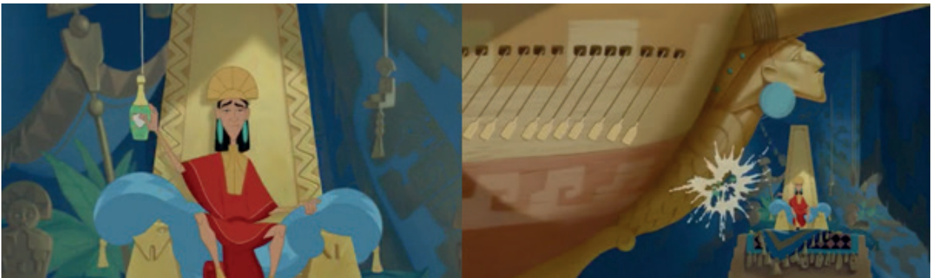
Ilustración 4. Fullmer (2000). Contaminación de los océanos [Figura]. En El emperador y sus locuras (Fullmer, 2000)

percibe una repercusión negativa en dicha acción. Esta situación se repite 6 décadas posteriores con el filme El emperador y sus locuras (Fullmer, 2000) cuando Kuzco recurre a una botella de champagne para bautizar uno de los barcos de su imperio, provocando la caída de desechos sobre el mar.