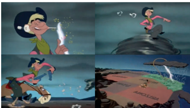
Ilustración 6. Disney (1948). Superioridad sesgada de la humanidad con respecto a la naturaleza en el corto “Roy Rogers y la historia de Pecos Bill” [Figura]. En Tiempo de melodía (Disney, 1948)

Se destaca como positiva la introducción por medio del audiovisual de esta problemática, ya que sirve para criticar de una manera satírica a la sociedad históricamente considerada como normativa e ideal. En este ejemplo cinematográfico, la maldad