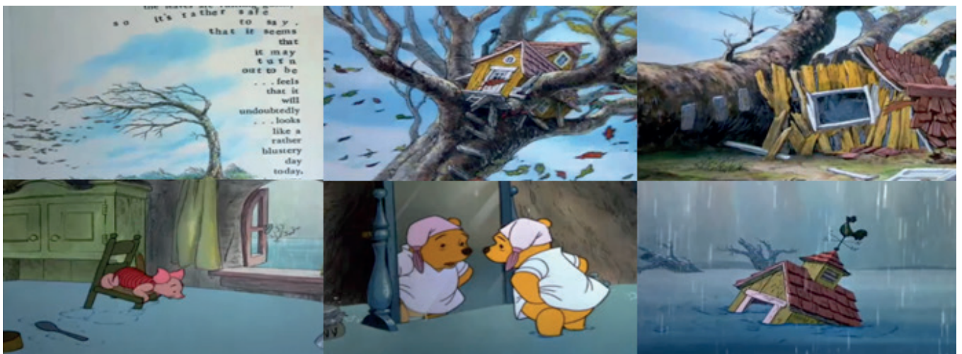
Ilustración 2. Disney (1977). Catástrofes naturales en el corto “El bosque encantado” [Figura]. En Lo mejor de Winnie Pooh (Disney, 1977)

Asimismo, llama la atención la normalización con la que se presentan situaciones que contaminan el medio ambiente. En el ámbito de la cultura visual, se defiende la eficacia que los discursos cobran cuando se presentan ante la población que carece de una alfabetización visual. Esta idea es defendida por autores como Monleón (2017) o Huerta, Alonso-Sanz y Ramon (2019). La materialización más significativa se desarrolla en el corto “El pingüino de sangre fría” del filme Los tres caballeros (Disney, 1944). Cuando Polo construye su barco para viajar desde el hemisferio sur hasta el trópico uno de sus compañeros lo bautiza con una botella de champagne; duda qué hacer con los restos de vidrio y finalmente los vierte sobre el océano, sobre su propio hábitat. Así se establece un símil con el comportamiento de la humanidad en cuanto a contaminación del planeta. La sociedad embrutece el espacio ya que no