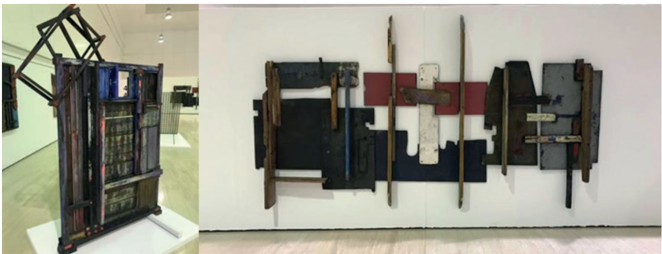
Ilustración 9. Frutos María (2019). Exposición de Frutos María “Acero y pecios del mar” en el MUA (Museo de la Universidad de Alicante) en noviembre 2019 [Figura]

En contraposición, destaca la presencia de Studio Ghibli como productora de animación concienciada con la ecología. Esta le concede un tratamiento indispensable en todas sus producciones, recrea espacios naturales que envuelven las historias, etc., de esta manera asienta un discurso naturalista en la audiencia, quien la considera un elemento indispensable de la propia existencia.