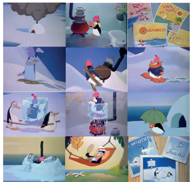
Ilustración 1. Disney (1944). Crítica sobre el calentamiento global en el corto "El pingüino de sangre fría" [Figura]. En Los tres caballeros (Disney, 1944)

Polo es un ave marina habitante del hemisferio sur a quien se le caricaturiza y se le atribuye una imposibilidad ficticia para soportar las bajas temperaturas de dicha región. Por ello, recurre a instrumentos humanos como la estufa para calentarse. Como dicha solución no es definitiva para suplir su necesidad, decide desplazarse hacia los trópicos, lugar en el que las temperaturas son mucho más cálidas.