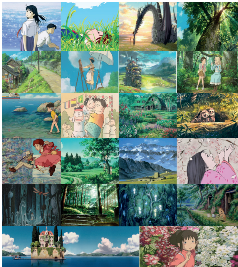
Ilustración 8. Studio Ghibli (1986-2014). Tratamiento de la naturaleza en la productora de animación oriental Studio Ghibli [Figura]

Todas estas ideas recogidas sobre cultura visual como vertiente de la Educación Artística, influencia sobre el desarrollo de la identidad en el colectivo in- fantil, favorecedora de una educación en valores de