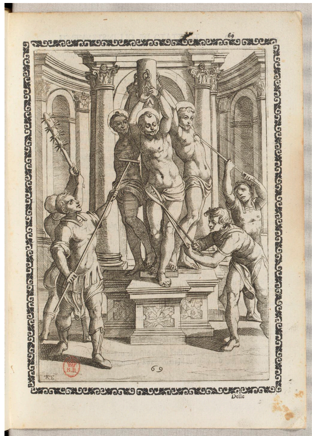
FIGURA 1 Martirio Gallonio Antonio ROMA 1591

Por tanto, y como negación a la belleza clásica de los cuerpos griegos, donde la perfección se sustenta en la medida, la proporcionalidad e integridad, se subvierten aquí los papeles para mostrar la perfección de lo abyecto y la desmesura. Una admiración por lo que nunca antes hubiera sido admirado.