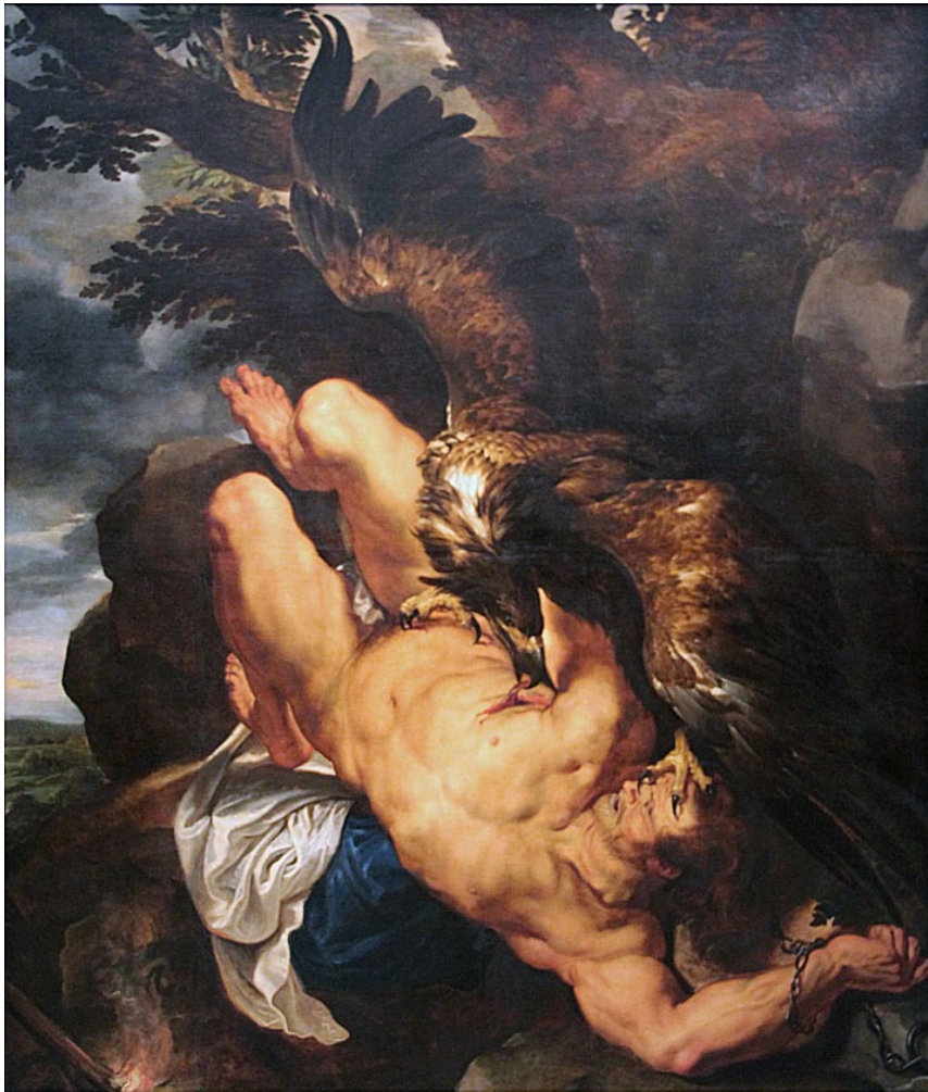
FIGURA 2. Prometeo Encadenado . P. Rubens. 1636 - 1637

Se observa la íntima relación, al igual que en toda la iconografía martirial que utiliza los códigos establecidos para su representación, que hay entre crueldad y voluptuosidad, entre placer y dolor. El propio Shelley concluye que el dolor es indivisible del placer de los hombres, y así lo manifiesta en su poema. Para los románticos la belleza parece aumentar, precisamente, por obra de aquellas cosas que deberían contradecirla: lo horrendo. Cuanto más triste y dolorosa es, más la saborean. Exactamente como el mártir del medievo representado en la pintura barroca, cuanto más dolorosa y horrenda era su tortura, mortificación que finalmente le conduciría a su muerte, más lo saboreaban, el reflejo de sus rostros gozosos representados indicaba una mejor recompensa celestial.