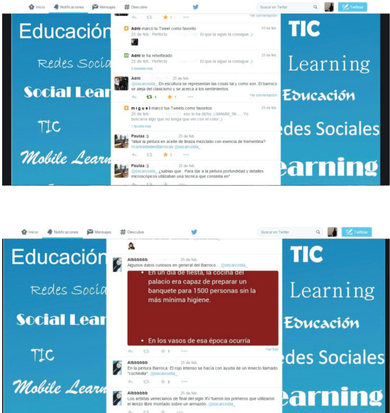
Figura 1. Respuestas de los alumnos ante la actividad: Busca peculiaridades propias del arte barroco.

nos y disminuye el fracaso escolar. En este sentido es importante destacar que los estudiantes se mostraron altamente participativos en las actividades propuestas y desarrollaron con agrado las diferentes actividades.