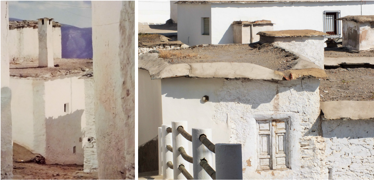
Fotoensayo Alpujarras . Gema Rocío Guerrero Higuera. 2014. Derecha: B. Rudofsky. Alpujarra (Detalle), 1972. Izquierda: Gema G. Guerrero Higuera. Alpujarras # 3. 2014.

2. Sreets for people . En la calle está la diversión. 28