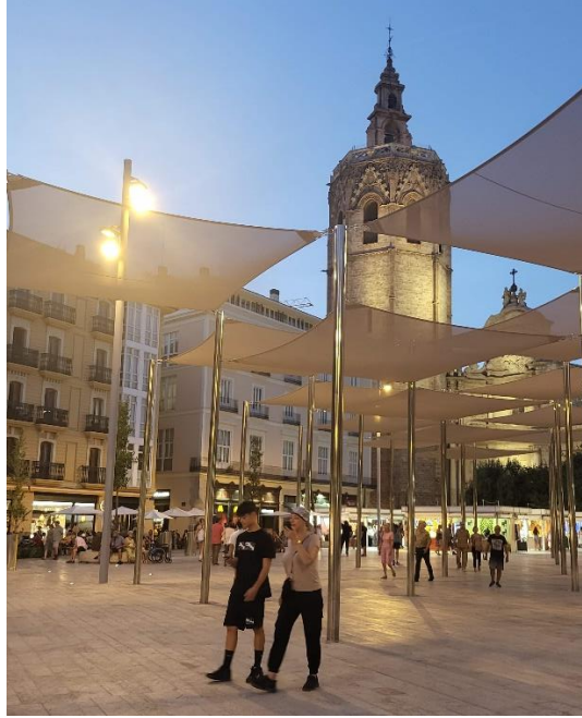
Imagen 1. Plaza de la Reina (Valencia) tras su remodelación (2022).

Por otro lado, es un escenario en permanente cambio. La estructura general del conjunto puede permanecer sin modificaciones durante un periodo de tiempo, pero los detalles que la diferencian y caracterizan están en constante cambio. Nunca se tiene una percepción definitiva, sino que se producen una sucesión de percepciones, como consecuencia de los cambios que acontecen.