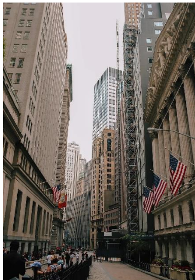
Imagen 4. Wall Street (New York), es uno de los centros económicos mundiales. El paisaje que se muestra se asocia con la prosperidad económica y con el poder social.