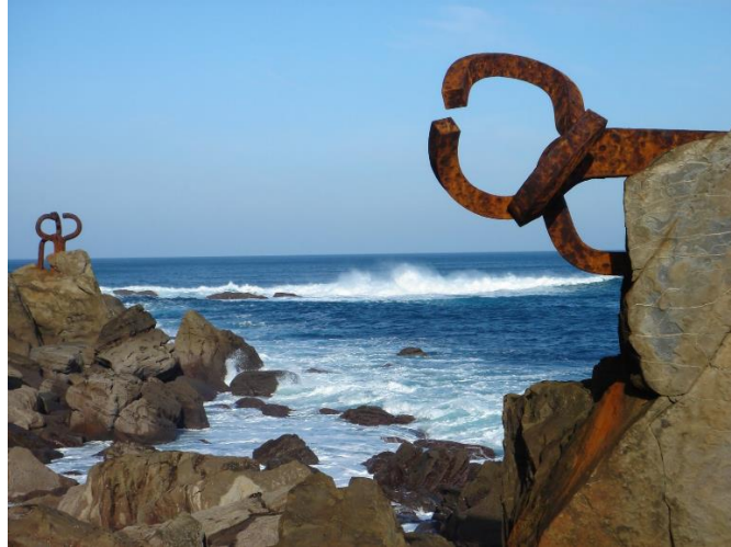
Imagen 2. Peine del viento XV. "El mar tiene que entrar en San Sebastián ya peinado". Eduardo Chillida, 1977. San Sebastián.

planteamientos (Bellmunt, 2006). Es el reflejo directo de una forma de entender la relación de los individuos con el hábitat.