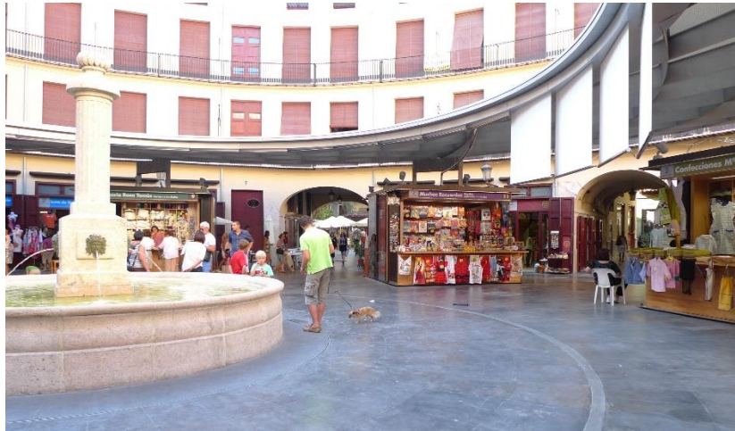
Imagen 6. Plaza Redonda (Valencia), un nodo en el que confluyen calles que se organizan en direcciones diferentes. Desde el interior de la plaza se perciben las diferentes opciones a recorrer.