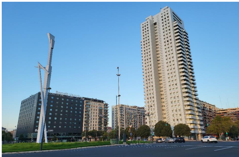
Imagen 7. Parotet, Miquel Navarro. Escultura situada en la Glorieta de Europa (Valencia). Los mojonés son elementos característicos y diferenciados del entorno que adquieren relevancia dentro del campo visual. Ofrecen al usuario un posicionamiento relativo en el entorno.