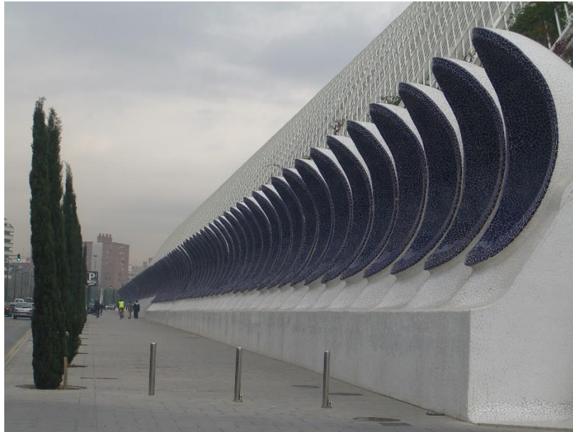
Imagen 6. Los bordes se muestran dentro del paisaje urbano como elementos que delimitan y organizan el espacio separándolo en distintas áreas de uso.