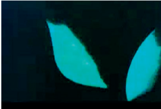
Figura 2. Opus 1 , Walter Ruttmann (fotograma).

Aún más evidente y declarada aparece esta subordinación en las creación de visualmusic de los años 20 y 30. Artistas como Mary Ellen Bute, Oskar Fischinger, Walter Ruttmann (Figura 2), para citar sólo algunos de los principales, que desarrollan imágenes animadas abstractas como visualización de la música, llegando hasta una especie de estructuralismo compositivo donde los parámetros musicales se transmiten de forma directa a parámetros visuales como la forma y el color. Probablemente la película comercial más cercana a la visualmusic de aquella época es representada por Fantasia producida por Walt Disney (Disney et al. , 1940), donde se sustituyen las imágenes abstractas por imágenes típicas del dibujo animado infantil, transfiriendo en esta acción los parámetros musicales ante citados. Ejemplar es la reinterpretación de La consagración de la primavera de Stravinski en la génesis geológica del planeta Tierra.