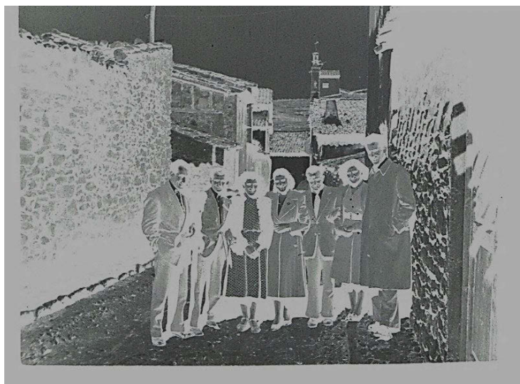
Fig. 3 Negativo en soporte plástico escaneado

Mediante el uso de un escáner específico sobre todo para los negativos, se procedió a la digitalización y revelado mediante software específico de la colección de negativos y ejemplares fotográficos habiendo recibido previamente una limpieza mecánica, con una pera de aire, brochas de pelo fino, material específico para la restauración etc., ajustándose niveles en su procesado digital.