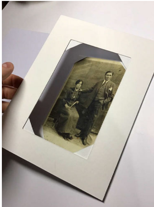
Fig. 6 Montaje de almacenaje con cartones y papeles de conservación