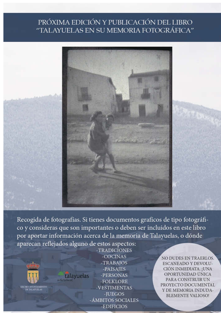
Fig. 1 Cartel anunciador del proyecto

En una primera lectura y revisión de los ejemplares, se realizó una catalogación con ayuda de fichas elaboradas expresamente para esta parte del proceso, donde figuran todos aquellos datos de interés, como pueden ser los datos del propietario, posible fecha, la identificación de los personajes/acontecimiento etc., así como el estado de conservación de los ejemplares y la tipología de soporte y técnica fotográfica. La identificación de los personajes a partir de los datos que aportaron sus familiares en una investigación etnográfica se complementó con la posterior consulta del registro civil y eclesiástico, además de la documentación de numerosos testimonios y anécdotas.