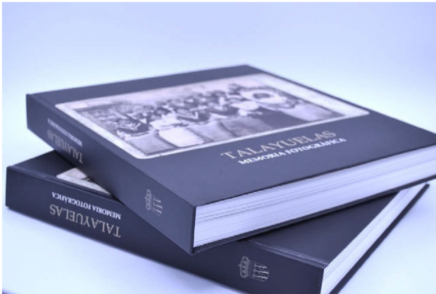
Fig. 5. Publicación “Talayuelas. Memoria fotográfica”

La impresión se llevó a cabo en un tamaño y soporte determinados, que permitieran llevar a cabo la lectura de los ejemplares ubicados en grupos dentro de un discurso intencionado. Los archivos se prepararon según exigía el laboratorio que realizó la impresión (perfil, tamaño, ppp, formato, etc). En este caso, la impresión y encuadernación se llevó a cabo por Gráficas Llogodí, se encargan 500 ejemplares para la primera edición.