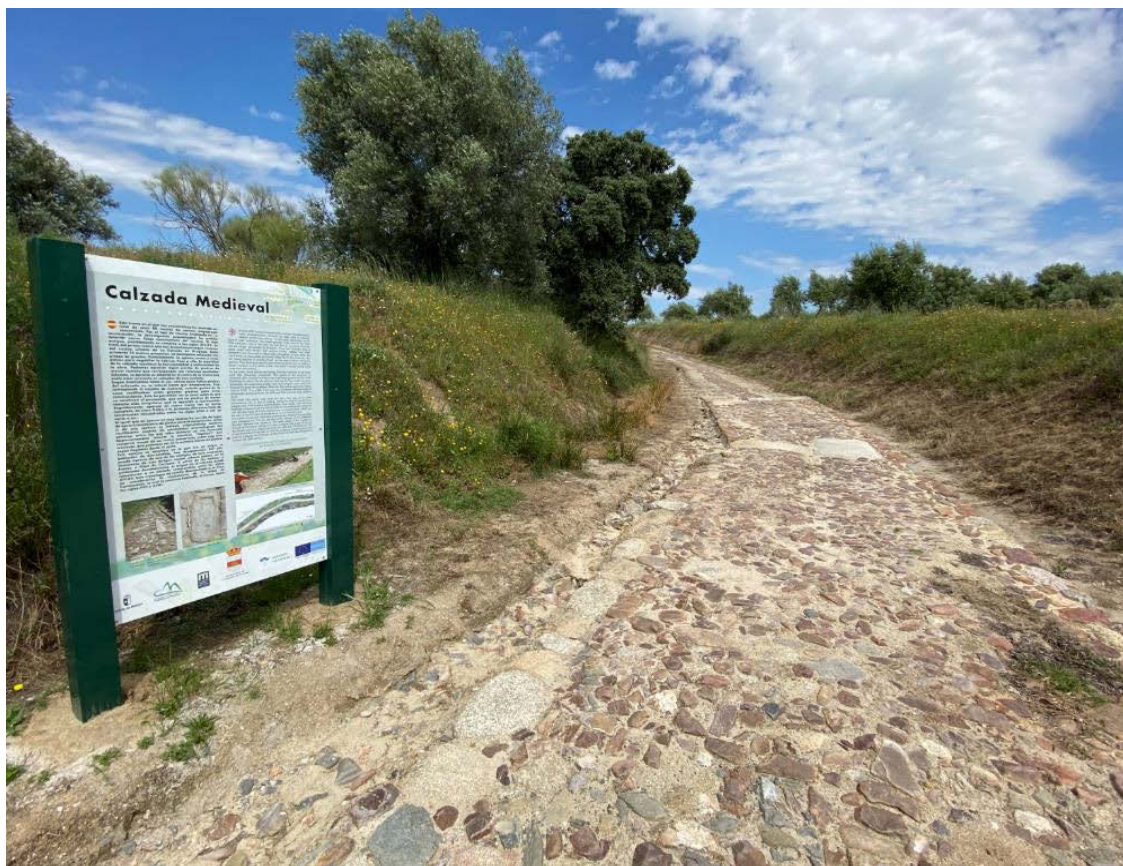
Fig. 2 Vista del tramo de calzada recuperada con panel interpretativo en La Calzada de Oropesa. 2020

La mayoría de los proyectos llevados a cabo conlleva la instalación de nuevos sistemas de señalización turística (Castillo de Bayuela, Cebolla, La Calzada de Oropesa, Oropesa, Parrillas y S. Bartolomé de las Abiertas). Algunos de los municipios han llevado a cabo ambiciosos proyectos mediante el diseño de itinerarios por el patrimonio cultural y natural como La Calzada de Oropesa (De la Llave, 2018c) y Parrillas (De la Llave, 2018a), sirviendo de impulso para la rehabilitación de algunos elementos etnográficos como lavaderos, tramos de calzada (Fig. 2) o fuentes-pilones. Otros pueblos han optado por sistemas de señalización más modestos como Castillo de Bayuela. En cambio, localidades como Cebolla (De la Llave, 2018b) o San Bartolomé de las Abiertas han complementado su señalización con la creación de un centro de interpretación y una oficina turística respectivamente.