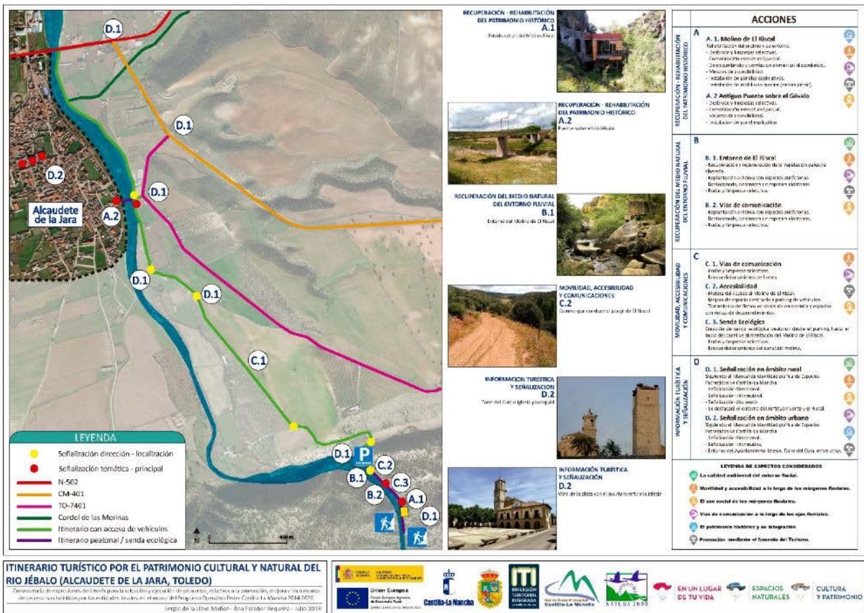
Fig. 3 Itinerario turístico diseñado en Alcaudete de la Jara. 2018

El grado de cumplimiento y ejecución de las propuestas ha sido variado. Por ejemplo, en la localidad de Parrillas, el cambio de signo político supuso una modificación de la propuesta original, restando en acciones como la excavación y recuperación de un tramo de calzada o la creación de un área de caravanas. Un caso singular ha sido el de la localidad de Alcaudete de la Jara que, pese a ser beneficiaria de la ayuda para el desarrollo de un plan de señalización e itinerario turístico (De la Llave, 2018d) (Fig. 3), rehusó de su puesta en marcha debido a las dificultades económicas del consistorio.