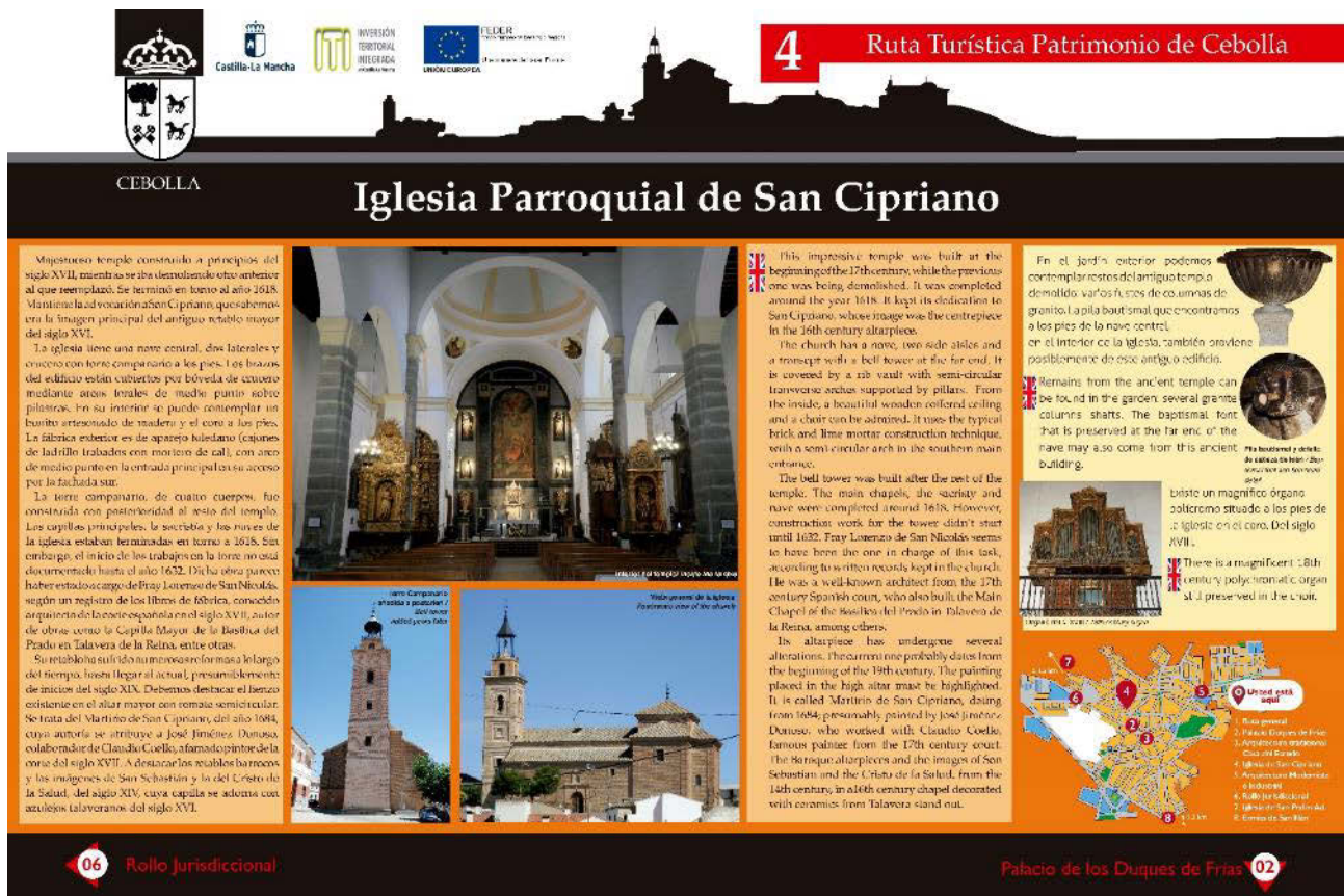
Fig. 4 Modelo de cartel interpretativo instalado en Cebolla. 2020

Resulta necesario homogeneizar algunos criterios como es lo referente a la señalización turística. Cuestiones como el diseño, tamaño, materiales o los soportes deberían estar sujetos a un manual de estilo común. Tal es el caso, de la Red de Áreas Protegidas de la región. Sin embargo, para el resto de áreas urbanas y rurales, se han aplicado diferentes perspectivas que rompen con una conveniente uniformidad visual para el visitante. Por su parte, consideramos que la aplicación de señalética monolingüe supone un desacierto, más si cabe cuando la atracción de visitantes extranjeros debe ser un complemento, tal es el caso del municipio de Castillo de Bayuela. En su caso, los proyectos de La Calzada de Oropesa, Parrillas y Cebolla si cuentan con textos bilingües (Fig. 4).