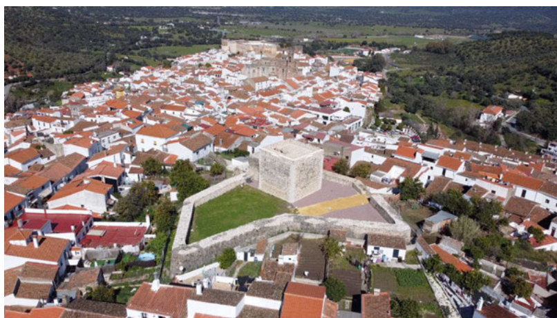
Fig. 2 Recuperación de la Torre de San Ginés.