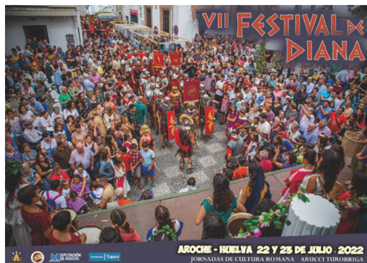
Fig. 3 Cartel del VII Festival de Diana

El Festival de Diana (Fig. 3), en concreto, es responsable de la creación del Grupo Municipal de Recreación Histórica Baebia Aruccitana , con una sección civil, otra militar, y una novedosa sección musical, vinculada al Aula Municipal de Música. Este grupo cuenta con un centenar de participantes de edades entre los 5 y los 75 años. Esto, unido al trabajo destinado a la sensibilización social local, a través de visitas guiadas periódicas, charlas, exposiciones, jornadas de puertas abiertas, etc., de alguna forma, ha permitido a las nuevas generaciones crecer con un renovado vínculo con su patrimonio.