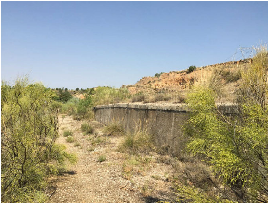
Fig. 4 Antiguo muelle de carga de la Cantera de Cornicabra. Martín de Torres, D. (2019)