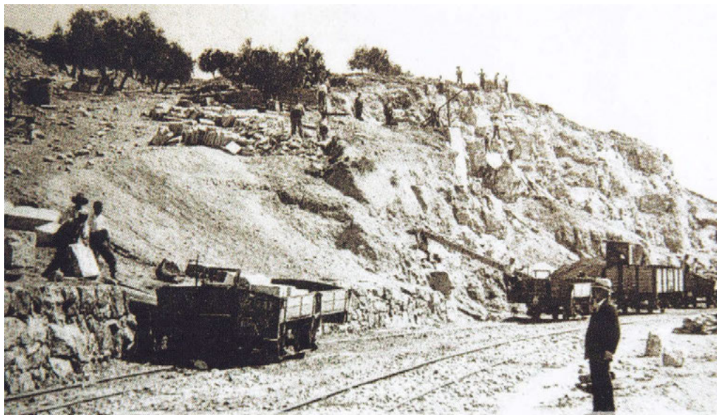
Fig. 1 Operarios cargando piedra en la Cantera de Cornicabra. Explotadora de la Cantera de Cornicabra, Ayto. De Morata de Tajuña. (1907)

del Tajuña, tuvieron un gran crecimiento, ya que se pudo abrir el mercado hacia otros puntos de la región. Esto hizo que la piedra de Morata, al igual que la de Colmenar de Oreja, comenzase a utilizarse en grandes obras de la capital madrileña, como puede ser el Hospital de Jornaleros de Maudes (1909-1916) que actualmente acoge diversas conserjerías de la Comunidad de Madrid (Pérez-Montserrat, 2017) el matadero Municipal de Madrid o las obras de la Línea 1 del Metro de la capital (Miranzo, 2018).