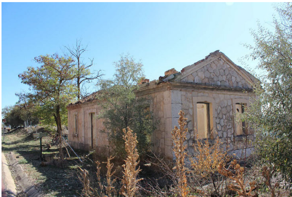
Fig. 3 Antiguo Apeadero de la Cantera de Cornicabra. Martín de Torres, D. (2019)

La pieza más importante que se aprecia en el conjunto es el antiguo apeadero. El edificio tiene planta rectangular y se encuentra dividido en tres estancias, una de ellas la central en la cual se sitúa el acceso y dos laterales. Todas las estancias están iluminadas mediante ventanas rectangulares de grandes huecos en comparación con la superficie del muro.