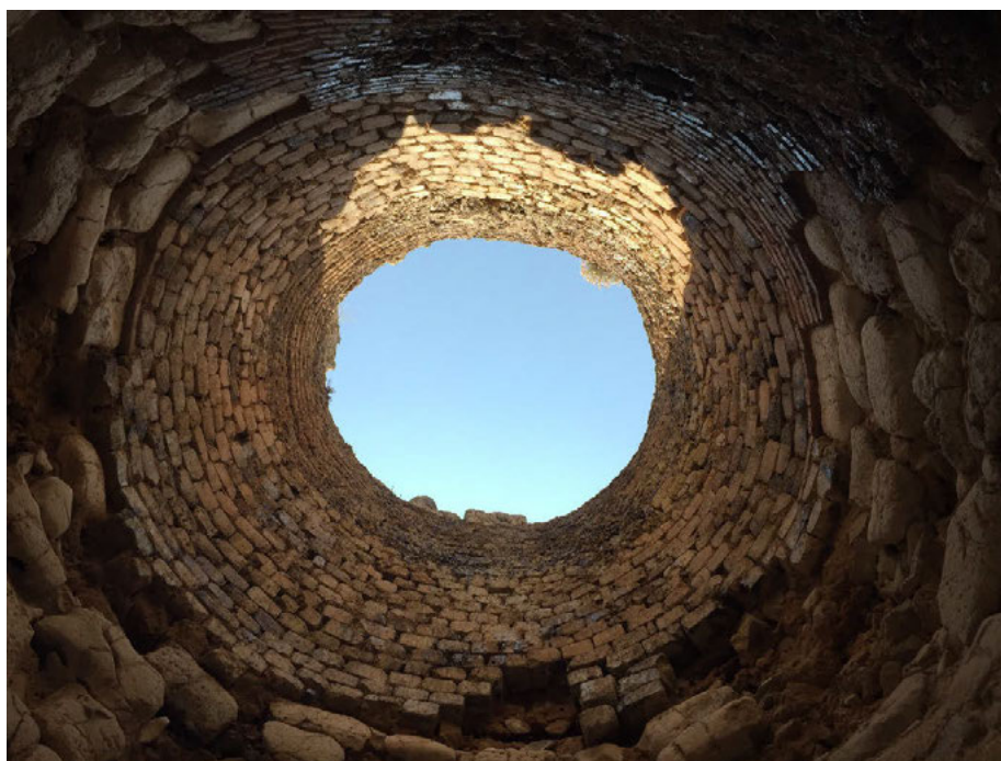
Fig. 6 Interior de la chimenea de un horno de cal de Cornicabra. Martín de Torres, D. (2019)

En la parte delantera de los hornos, aparecen construcciones posteriores realizadas en muros de mampuesto de caliza que posiblemente fuesen utilizadas como almacenes del conjunto minero.