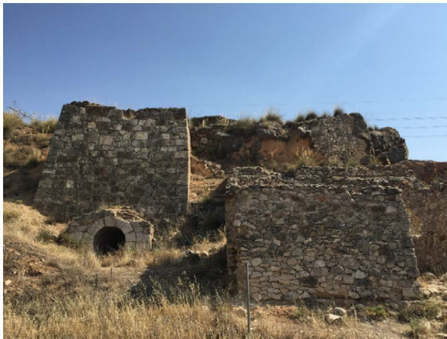
Fig. 5 Exterior de los hornos de cal de Cornicabra. Martín de Torres, D. (2019)

Los elementos más significativos y apreciables del conjunto, a parte del apeadero y del corte de la cantera de piedra caliza, son los hornos de cal que aún se conservan en Cornicabra. El conjunto está compuesto por tres hornos, dos de ellos adosados y otro de mayor envergadura exento que se adosan a la pared de la cantera aprovechando el desnivel. La construcción de los hornos adosados se realizaba para obtener mayor rendimiento ya que se aprovechaba de mejor forma el calor empleado en la calcinación y aumentaba así la producción. (Barbero, 2011).