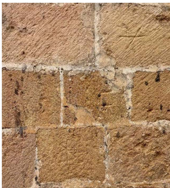
Fig. 2 Vista en detalle de la sillería en donde es posible apreciar diferentes marcas de cantero

Ahora bien, como la iglesia ha sido intervenida en varias ocasiones es posible que se hayan empleado piedras de estratos diferentes; incluso, es posible que paños ejecutados en la misma etapa histórica fueran construidos con piedras de distintos frentes de cantera. De hecho, históricamente se han explotado los estratos inferiores de estas canteras del barrio de San Marcos de Segovia y de Zamarramala, buscando la piedra con tamaño de grano más fino y color más claro, por ser considerada de mejor calidad para la talla.