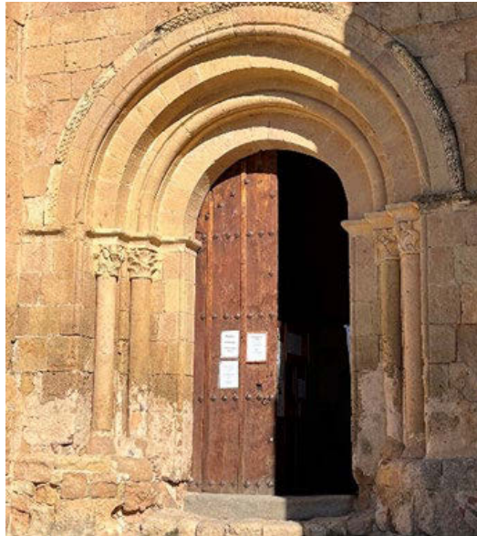
Fig. 3 Vistas en detalle de la portada de la iglesia, se muestra el deterioro en la piedra del Parral, especialmente en la parte baja. También se aprecia la diferente textura de los capiteles, probablemente reconstruidos en alguna de las intervenciones de restauración

Tanto piedras como morteros son materiales de origen mineral, por lo que las técnicas geológicas son las más adecuadas para su estudio, tanto composicional, como de deterioro. La secuencia prevista permitirá una caracterización de gran cantidad de muestras en difracción, para lo que se precisan tan solo unos gramos, que pueden ser tomados si fuera necesario con un bisturí, y tras un primer análisis global pasar a una toma selectiva de muestras para microscopía.